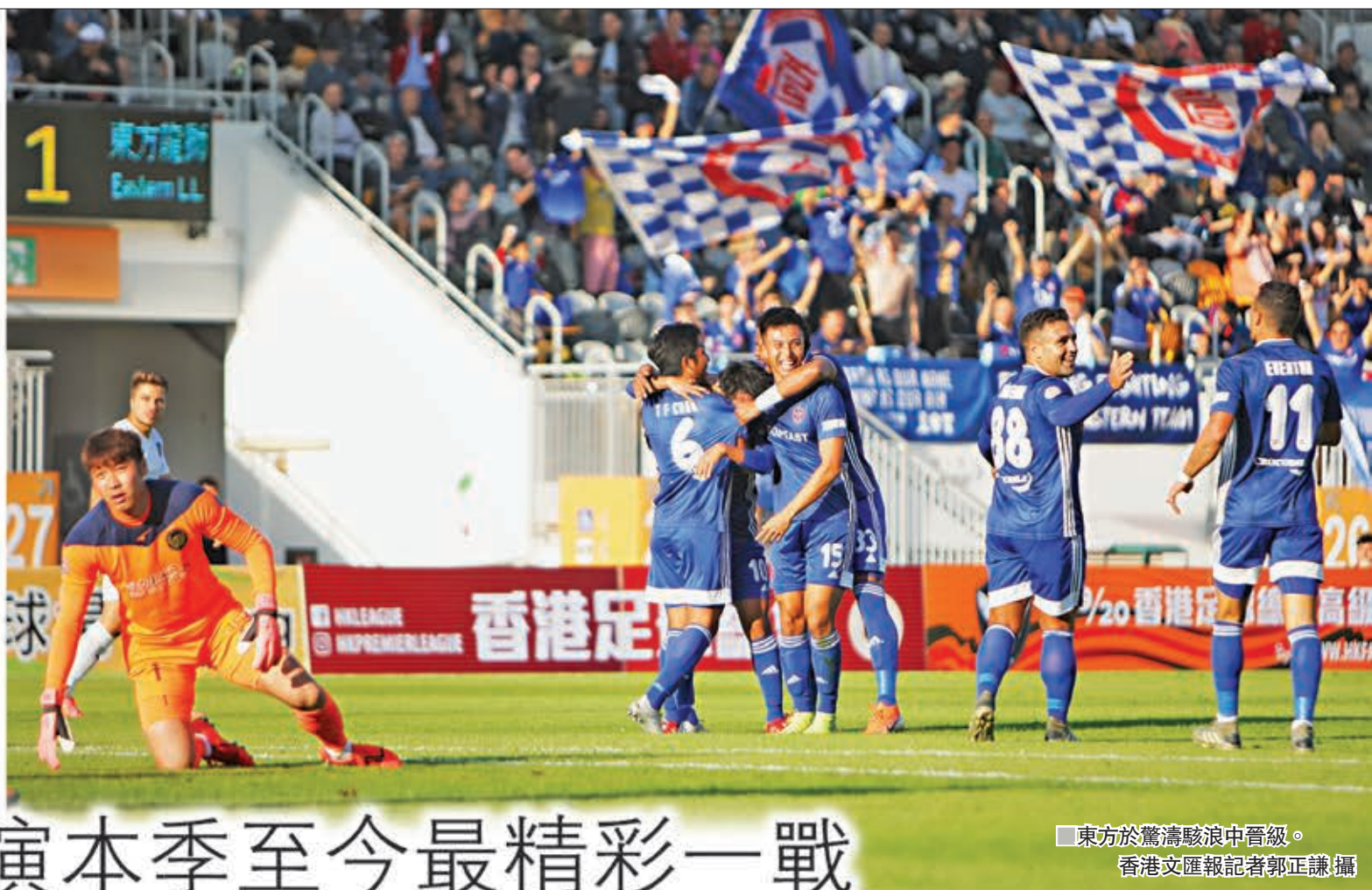
東方於驚濤駭浪中晉級。