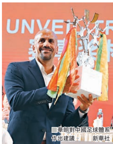
華朗對中國足球體系作出建議。