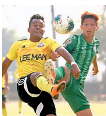
理文（左）與大埔再度相遇。

理文今季表現煥然一新，經過早前1：5不敵富力的敗仗後，球隊士氣不但未有受挫反而越戰越勇，接連擊敗傑志及東方龍獅兩大勁旅。賽前已明言以冠軍為目標的理文，於聯賽打一場下落後榜首富力三分，前途一片光明，如今場能擊敗大埔更能晉身高級組銀牌決賽，朝着今季首個錦標邁進一大步。