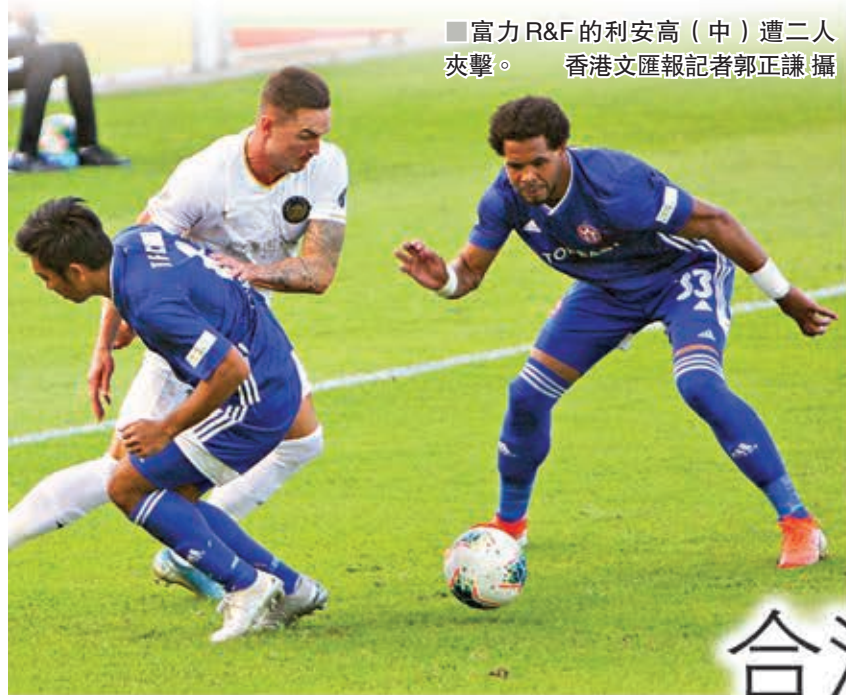
富力R&F的利安高（中）遭二人夾擊。

香港文匯報訊（記者 郭正謙）昨日進行的高級組銀牌四強賽，東方龍獅與富力R&F合演本季至今最精彩一戰，東方憑藉於最後10分鐘連入三球以5：3反勝富力率先晉身決賽，雙方合共奉獻8個入球為近2千名入場觀眾送上這場逆轉好戲。