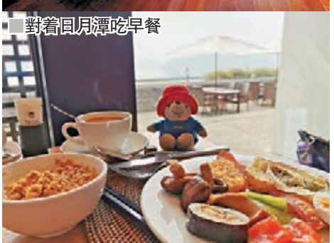
對着日月潭吃早餐