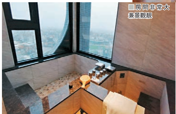
房間非常大兼景觀