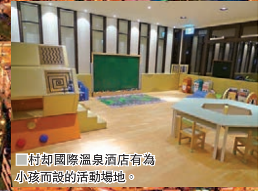
村却國際溫泉酒店有為小孩而設的活動場地。