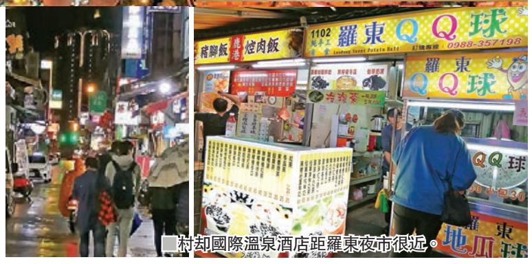
村却國際溫泉酒店距羅東夜市很近。