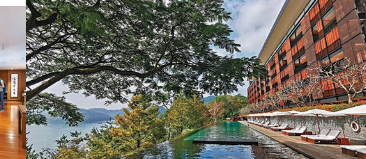
涵碧樓，擁有得天獨厚的自然美景。