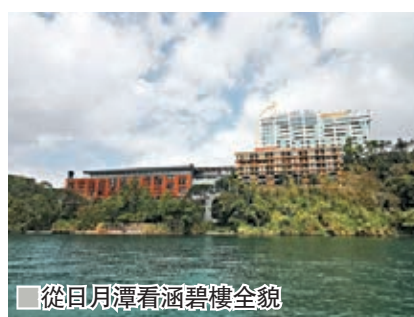
從日月潭看涵碧樓全貌