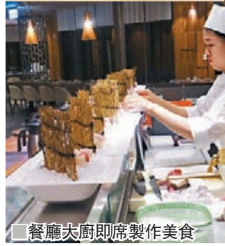
餐廳大廚即席製作美食