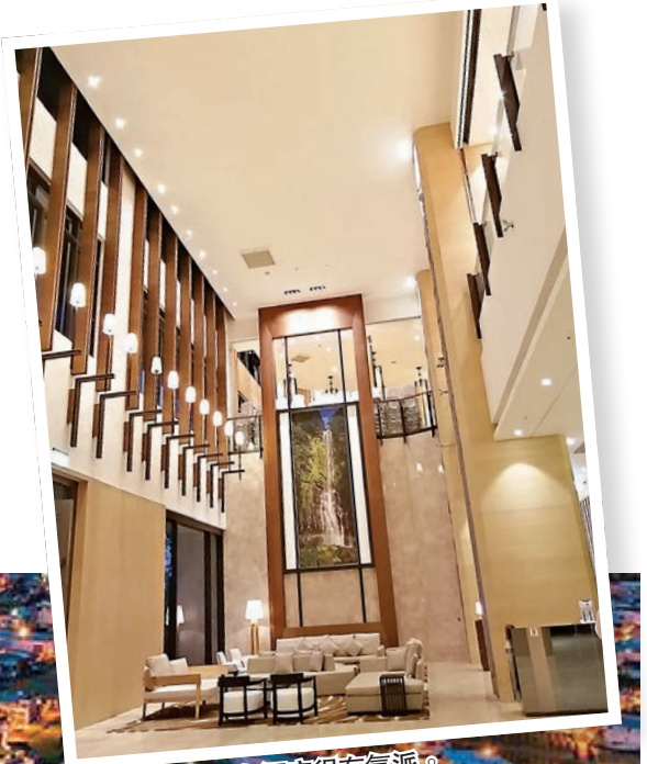
村却國際溫泉酒店很有氣派。