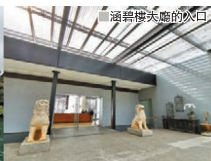
涵碧樓大廳的入口