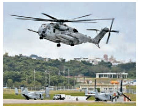
■尼克松最終撤除所有部署沖繩的核武。資料圖片