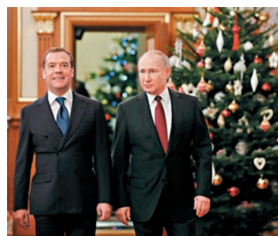
■普京(右)與總理梅德韋傑夫出席政府會議。