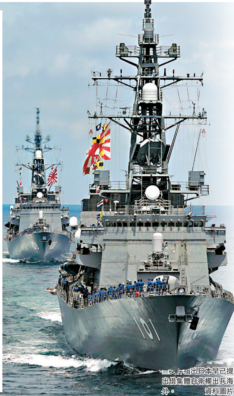
▲分析指出日本早已提出借集體自衛權出兵海外。資料圖片