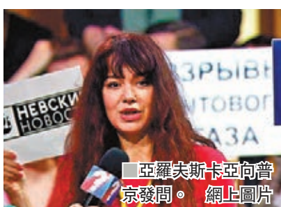
亞羅夫斯卡亞向普京發問。

俄羅斯總統普京上周舉行年度記者會期間，一名來自西伯利亞馬爾地區國營電視台的女記者，在會上向普