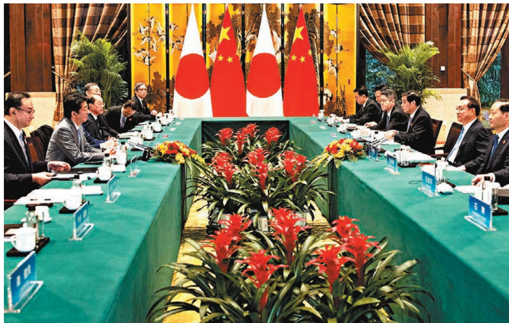
李克強在會上表示，中日應推動兩國關係在重回正軌的基礎上不斷實現新的發展。