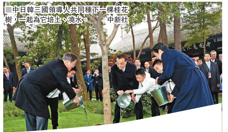
中日韓三國領導人共同種下一棵桂花樹，一起為它培土、澆水。