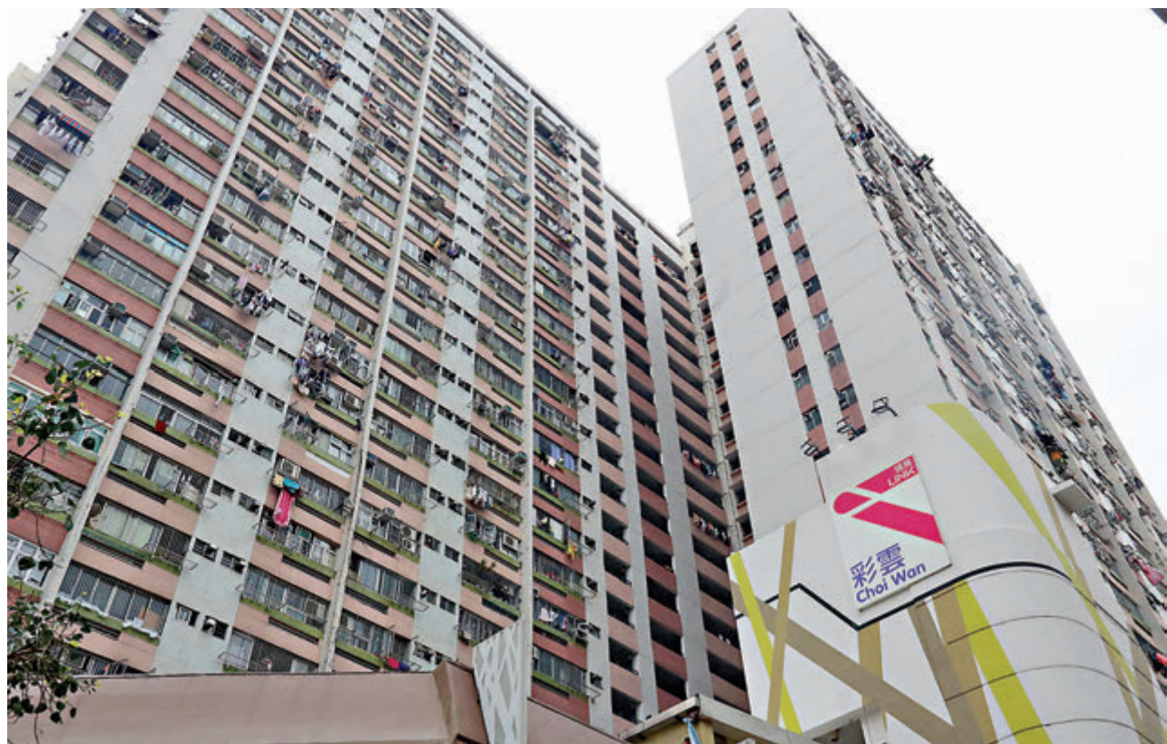
房委會宣佈，居於轄下公屋戶繳交一般租金的租戶，將毋須繳付2020年1月份租金。圖為彩雲邨。

香港文匯報訊(記者 費小輝)香港經濟環境欠佳，特區政府早前宣佈一系列支援及紓困措施，與市民共度時艱。其中，政府會由下月起推行新一輪電費補貼，向每個合資格電力住宅用戶戶口分12個月合共提供2,000元補貼，同時會為繳交一般租金的公屋租戶代繳下個月的租金。單計2,000元電費補貼的一次性措施，涉及約56億元政府開支，惠及超過270萬個合資格住宅用戶。