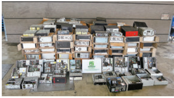
環境保護署早前於海關協助下，在葵涌貨櫃碼頭截獲屬「四電一腦」電器廢物的廢電腦。

發言人強調，根據《廢物處置條例》，任何人進出口受管制電器廢物(即被棄置的「四電一腦」包括空調機、雪櫃、洗衣機、電視機、電腦、打印機、掃描器及顯示器)，必須事先領有環保署署長發出的許可證，否則即屬違法。為防止本港成為進口廢物的棄置地或非法進出口廢物的集散地，環保署會嚴厲執法，並與海關緊密交流情報及協作，加強堵截以不同途徑非法進入香港的各類廢物。發言人提醒從事電器廢物回收的進