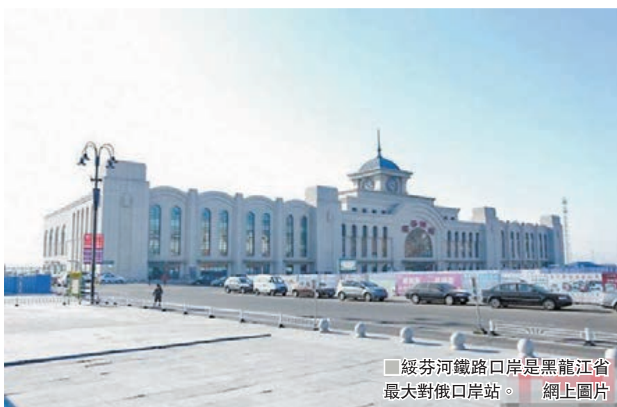
綏芬河鐵路口岸是黑龍江省最大對俄口岸站。

數據顯示，綏芬河鐵路口岸進出口運量實現1,071.4萬噸，同比增長10.5%，其中入境1049.7萬噸，出境21.7萬噸。預計到年底，綏芬鐵路口岸進出口運量將實現1,100萬噸。