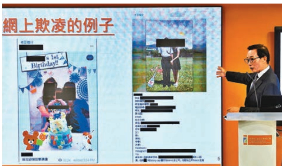
個人資料私隱專員公署就起底及網絡欺凌行為發表最新報告，公署已將其中1,402宗涉嫌違反《私隱條例》個案交予警方。圖為私隱專員黃繼兒早前發表同類報告。資料圖片

行為會觸犯《私隱條例》第六十四條刑事罪行，當中有六成七鏈結已被移除。 國際協作打擊境外平台起底 公署已去信提醒有關平台或網站營運商，高等法院已發出臨時禁制令，禁止任何人非法地及故意地公開警員及其家人的個人資料，以恐嚇及騷擾警員及其家人。截至上星期五，公署總共轉介40宗個案予律政司跟進。至於多個在境外運作的平台，私隱專員亦已去信當地的保障個人資料私隱機構，尋求國際協作打擊該平台上的起底行為。 黃繼兒重申，網上社交平台和討論區有法律和社會責任不協助或促進有關起底的違法行為。他說，今年10月，來自全球超過120