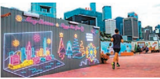
設計師希望透過霓虹燈藝術,為遊人帶來更濃厚的聖誕氣氛和展示香港城市獨有的活力。