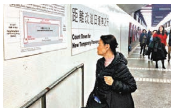
目前通道出入口已張貼告示和路線圖,方便市民了解改道詳情。網誌圖片

他又指,今次會藉著全面翻新街市大樓的契機,革新大樓內為市民提供的各項設施,例如翻新後的行人通道會增設公眾洗手間,日後與新通道同