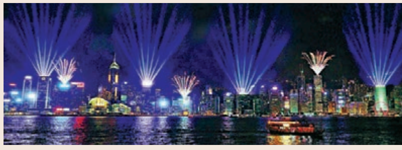
今年「香港除夕倒數」活動將上演加強版「幻彩詠香江」燈光音樂匯演。

他並指,於除夕當晚11時59分起,灣仔會展的外牆會變身為大型倒數時計。踏入元旦零時零分,全長約10分鐘的加強版「幻彩詠香江」匯演隨即在維港上演,再配合在港島區五六大廈樓頂發放的煙火,以及會展外牆顯示的「2020」字樣,一起共迎新的一年來臨。ViuTV 99頻道、旅發局網站及社交平台均會全程直播匯演。