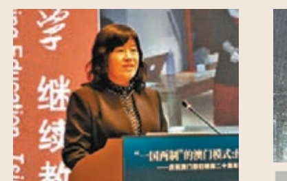
張文雪 香港文匯報記者帥誠 攝

今年是澳門回歸20周年，也是橫琴新區開發10周年。10年來，橫琴通過高標準建設基礎設施，為承載澳門產業多元發展提供基本條件；同時積極配合澳門「一中心、一平台、一基地」建設，促進澳門產業多元發展取得初步成果。而圍繞自貿區改革創新，努力為澳門企業在橫琴發展提供優良的營商環境。此外，橫琴拓展合作領域，推動對澳合作從產業協同走向社會民生融合。