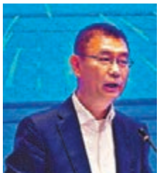
澳門中聯辦副主任姚堅致辭。