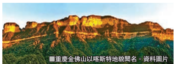
■重慶金佛山以喀斯特地貌聞名。資料圖片

推介會期間，廣州市文廣旅局與南川區文旅委簽訂戰略合作協議；廣之旅等11家旅行社與重慶山水公司簽訂旅遊合作協議，並啟動大灣區「金佛山之旅」攬客活動。