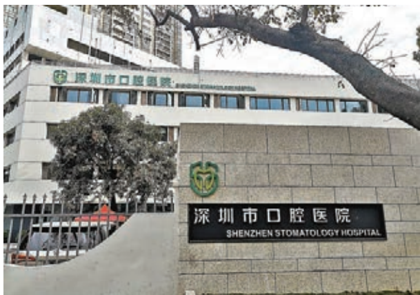
■深圳市口腔醫院昨日試業。