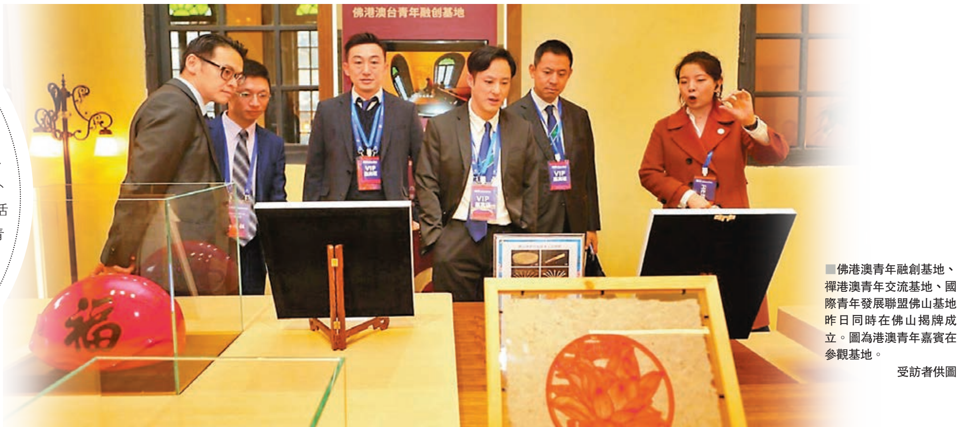
■佛港澳青年融創基地、禪港澳青年交流基地、國際青年發展聯盟佛山基地昨日同時在佛山揭牌成立。圖為港澳青年嘉賓在參觀基地。

香港文匯報訊 (記者 帥誠 佛山報導) 佛港澳青年融創基地、禪港澳青年交流基地、國際青年發展聯盟佛山基地昨日同時在佛山揭牌成立，基地將面向佛港澳青年開展經貿交流、產業合作、文體旅遊、教育交友、參觀考察、見習實習、公益服務等融合交流活動。三大基地將雙向對接高素質青年人才和優質企業資源，搭建青年創新創業和就業服務平台，成為港澳青年在佛山市的全新集聚地，一個面向港澳展示佛山形象的窗口。