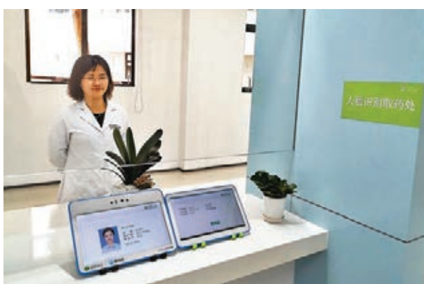
■人臉識別取藥處。

香港文匯報訊(記者 郭若溪 深圳報導) 深圳第一家市屬公立口腔醫院——深圳市口腔醫院昨日正式試業。醫院定位三級口腔專科醫院，規劃牙椅100張、病床50張，目標是建設集醫療、科研、教學、預防保健等功能為一體的現代化口腔專科醫院。和傳統醫院不同，該醫院是深圳首家「無感醫院」，患者靠著一部手機，就能掛號、排隊全搞定，預計就醫時間比傳統醫院節省20分鐘至40分鐘。該院更使用人臉識別技術刷臉就診、取藥。