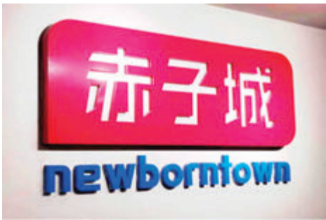
■赤子城為今年唯一超購逾千倍的新股，榮登今年 IPO「超購王」。

日前閉幕的今年中央經濟工作會議首提「要大力發展數字經濟」，赤子城可謂食正國策，加上業務相近的 360 魯大師（3601）於上市後一度倍升，引發市場憧憬，招股反應空前。赤子城昨截止招股，據市場消息，該股超額認購錄得逾 1,400 倍，超越亞盛醫藥（6855）成為今年首隻超過 1,000 倍的超購王，凍資約 343 億元。赤子城是次發售 1.36 億股，本地公開發