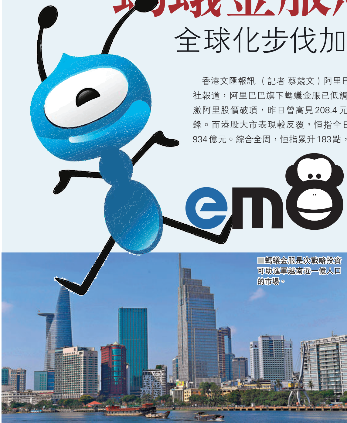
■螞蟻金服是次戰略投資可助進軍越南近一億人口的市場。

香港文匯報訊（記者 蔡競文）阿里巴巴（9988）悄然加快了全球化步伐。據路透社報道，阿里巴巴旗下螞蟻金服已低調入股越南電子錢包服務商 eMonkey。消息刺激阿里股價破頂，昨日曾高見 208.4 元，收報 207 元漲 1.07%，創上市以來新高紀錄。而港股大市表現較反覆，恒指全日收報 27,871 點，僅升 70 點或 0.25%，成交 934 億元。綜合全周，恒指累升 183 點，企穩於 250 天線上。