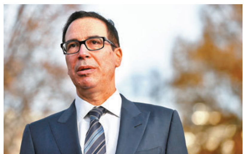
努欽表示，第一階段貿易協議已經全部完成，現只是在進行技術「梳理」。

美國農業部本周四公佈的數據顯示，截至12月12日當周，美國的豬肉對華出口總量為15,282噸，為至少2月或更早以來的最高。美國農業部表示，中國進口商上周淨購買5,940噸美國豬肉，將在今年年底前發貨。另在始於9月1日的2019/20市場年度，上周對中國的大豆出口總量為689,575噸，為三周高點。該機構還通過其每日報告系統確認向中國出售12.6萬噸大豆。