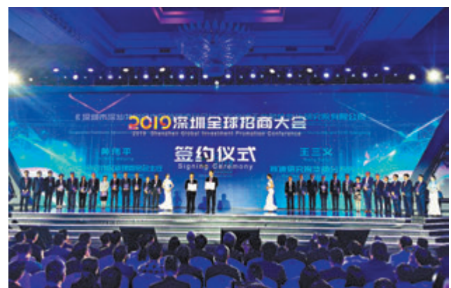
2019深圳全球招商大會, 現場簽約項目128個, 總投資超5,600億元人民幣。

據悉, 是次簽約的企業包括西門子(中國)公司、復星高科技集團、物美科技集團、潤世華新能源控股集團等。世界500強和大型跨國企業、央企、行業領軍企業代表, 駐華使領館代表, 友好城市官員等近600位嘉賓參加大會。