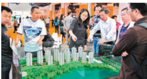
廣州一樓盤現場。

香港文匯報訊(記者 盧靜怡 廣州報道) 為落實中央惠及港澳措施, 廣州對港澳人士在穗購房資格「再鬆綁」。香港文匯報記者昨日致電廣州市不動產登記中心證實, 從12