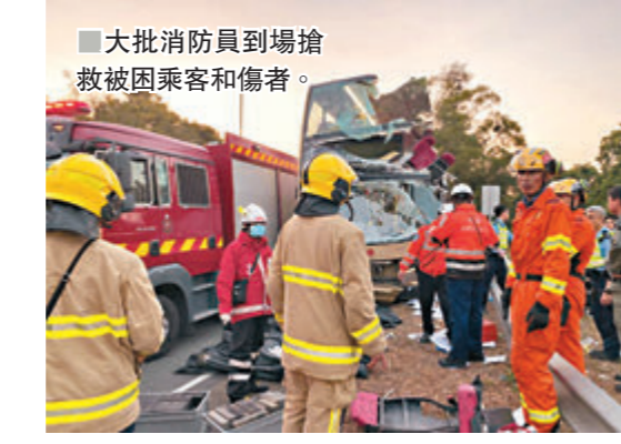
■大批消防員到場搶救被困乘客和傷者。

4年前同一天5死車禍 只差一句鐘 4年前的12月18日，元朗也發生小巴5死13傷車禍。不可思議的是，該意外與昨日的車禍同樣發生於4時許，只差一小時就變成同月同日同時。 事發於4年前2015年的12月18日下午4時許，一輛24噸貨車沿元朗錦上路左線西行至近東匯路交界前停穩。其間，司機突然開車駛走，令一輛沿東匯路北行駛至的九巴緊急煞停在路口閃避。