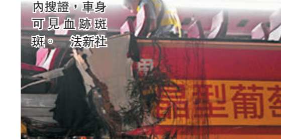
■警方在巴士內搜獲，車身可見血跡斑斑。