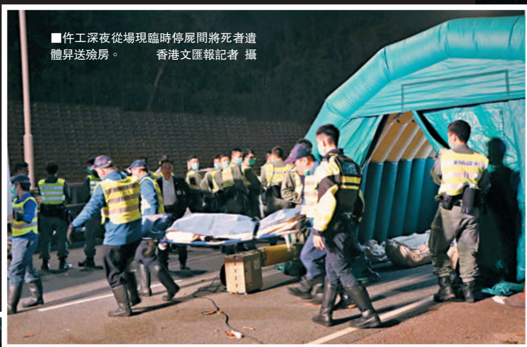
■作工深夜從現場臨時停屍間將死者遺體昇送殮房。

但當時車門損毀無法打開，他透過車門看見有人躺在馬路上，相信是從巴士上層被拋出的乘客，感到好恐怖。順利落車後，他轉身一看，發現巴士上層被全割開，他知巴士不是撞車而是撞樹。