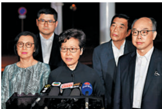
■林鄭月娥聯同多名官員昨晚到醫院探望車禍傷者。

香港文匯報訊（記者 文森）粉嶺公路昨日發生致命巴士意外，釀成6死39傷。行政長官林鄭月娥聯同多名官員，昨晚迅速到北區醫院探望傷者。林鄭月娥對意外感震驚及難過，特區政府會盡一切方法為死者家屬、傷者提供協助，並強調去年大埔車禍發生後政府成立獨立檢討委員會就巴士行車安全提出多項建議，政府會檢視有關建議是否需要加強。