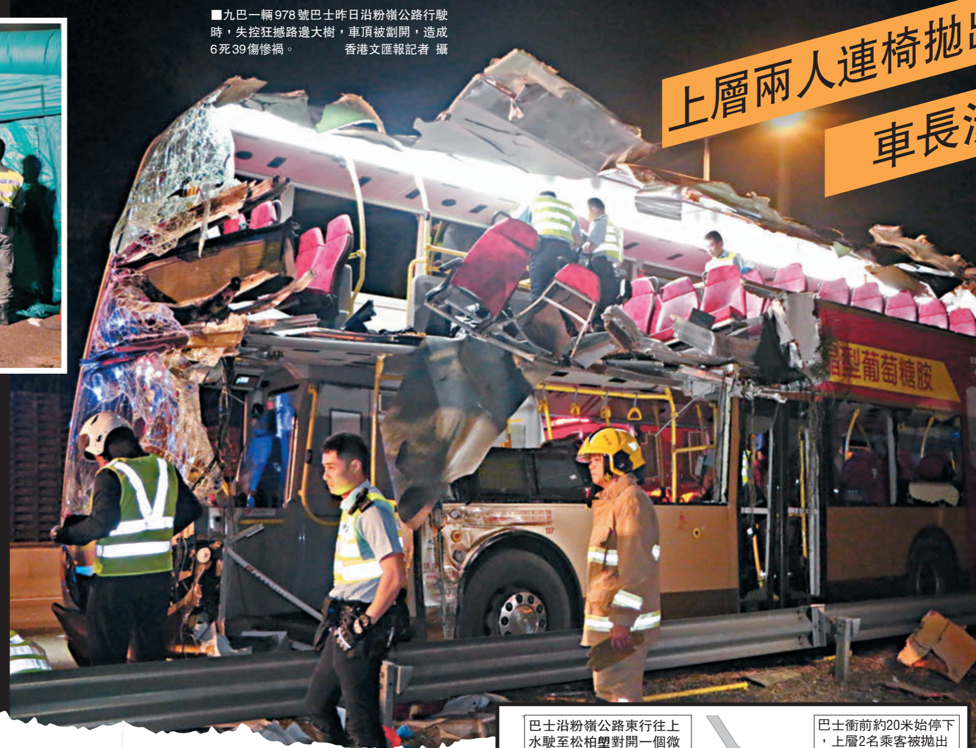
■九巴一輛978號巴士昨日沿粉嶺公路行駛時，失控狂越路邊大樹，車頂被割開，造成6死39傷慘禍。