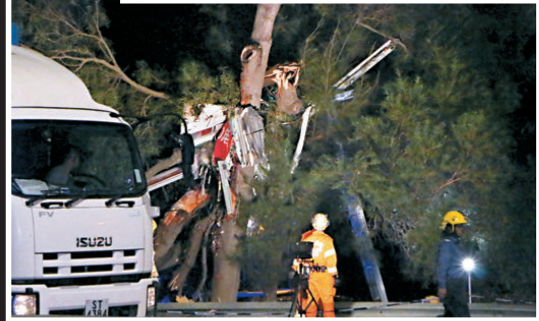
■巴士被割開，車頂殘骸仍掛在樹上，須消防員攀梯取下。