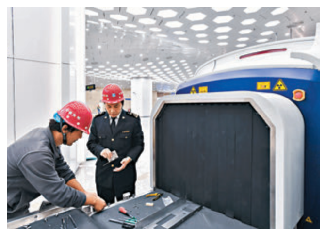
■海關人員查看設備調試進度。