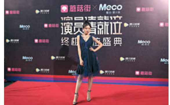
顏卓靈在內地真人騷綜藝節目《演員請就位》中翻唱王菲的《致青春》。