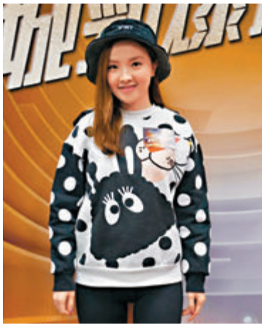
今年有三首歌競逐《新城勁爆頒獎禮2019》，Mag對奪獎有信心。