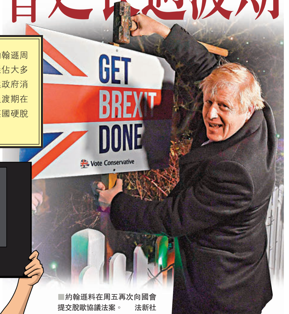
■約翰遜在周五再次向國會提交脫歐協議法案。