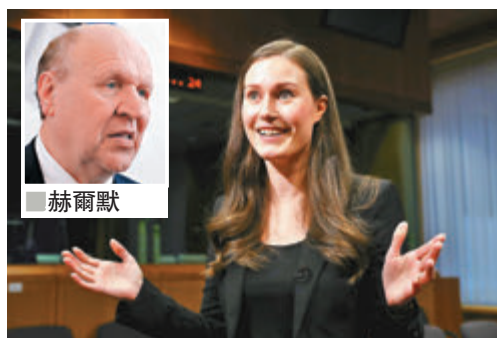
■馬林被嘲笑為「女售貨員」。

愛沙尼亞內政部長赫爾默斯周日前在電台節目上，嘲笑年僅34歲的芬蘭新任女總理馬林為「女售貨員」，並質疑其治國能力。愛沙尼亞反對派不滿赫爾默斯的言論，要求他下台，總統卡柳萊德前日就有關言論向芬蘭道歉。