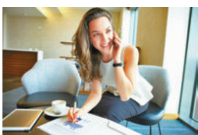
■全球職場性別差距逐漸擴大。

世界經濟論壇(WEF)昨日發表有關男女性別平等的年度報告，指出全球職場性別差距逐漸擴大，女性待遇在