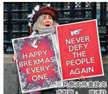
■民衆支持盡快完成脫歐。

英國《每日電訊報》前日報道，由於現時英國上議院的疑歐派勢力單薄，首相約翰遜計劃在上議院安插多名支持脫歐的專家，包括律師、貿易專家及環保人士，確保脫歐協議在國會兩院順利過關。