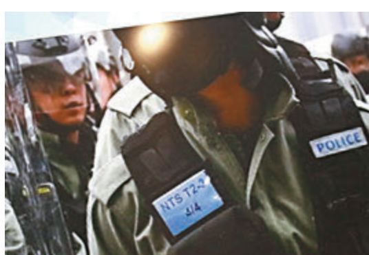
▲警方共發出1.4萬張行動呼號卡,公眾可憑卡識別警員身份。

香港文匯報訊(記者余韻)暴徒幼齡化問題嚴重,令教育界深感擔憂。聖誕長假臨近,民建聯昨日發聲明指,學生被煽動參與違法行為的風險或會增加,呼籲他們遠離暴力,亦希望教育局督促全港學校向學生及家長作溫馨提示,提醒要以安全及知法守法為首要考慮,以免危害自身安全或干犯法紀。 反修例風波被捕學生人數持續上升,更有教職員涉參與暴動和測試爆炸裝置而被捕,民建聯坦言,對恐怖活動在校園有抬頭的跡象感擔心,更憂慮聖誕及新年長假期間,學生被煽動的風險會增加。 聲明提到,歡迎有辦學團體已向屬下中學發溫馨提示,提醒學生及家長知法守法,遠離出現破壞性活動的地方,更希望教育局能敦促全港學校仿效相關做法並促請各界不應將政治及暴力活動帶入校園,以保障學生的安全和學習權利。 對於早前多名學校教職員涉違法被捕,當中有人遭學校停職,煽暴派隨即散播所謂「未審先判」論意圖包庇涉暴教師。民建聯強調不認同有關說法,認為司法程序會公平對待每一個被告,但保障學生安全更是學校責任,若以未有審訊結果為由,而不將涉事教職員停職,實屬罔顧學生安危,教育局及學校都有欠家長交代。