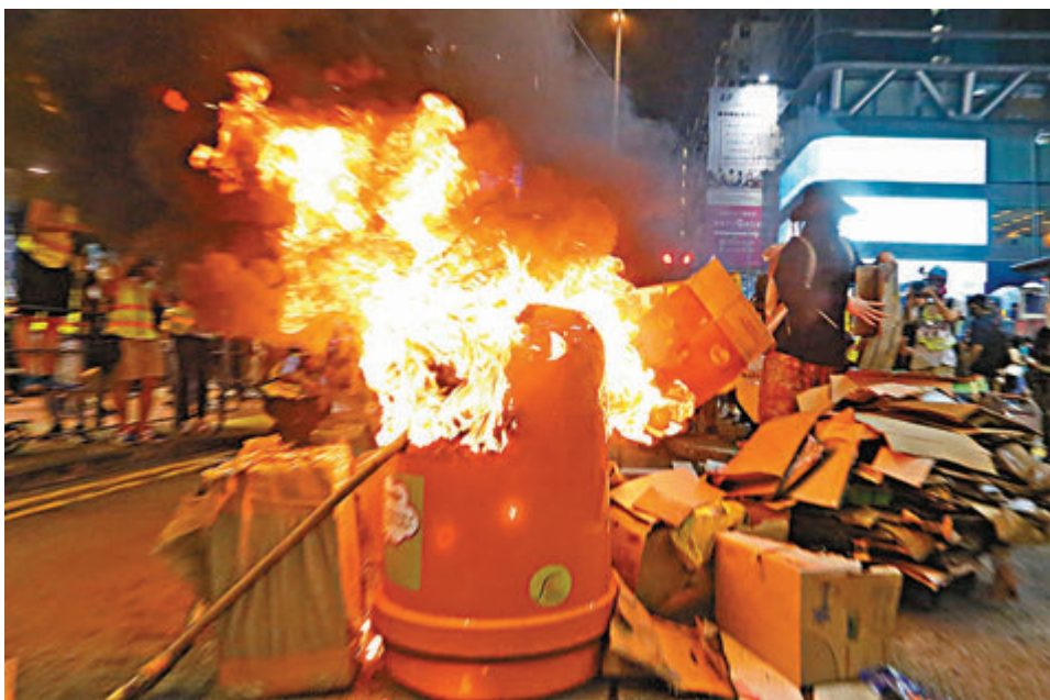
報告指暴徒焚燒其他物料如PVC或垃圾,才是二噁英出現元兇。

報告指出,根據不少國際文獻顯示,只要物料有少量氯化物例如PVC或鹽分,已足以形成二噁英。在本港,PVC常用於電線、電纜、膠喉管、膠地板、汽車配件、馬路膠圍欄和路上的「雪糕筒」,也有PVC製成的膠摺椅、摺椅及辦公椅等;由於香港是近海城市,鹽分也廣泛存在於本港的環境中,故露天焚燒垃圾確實可產生少量二噁英。