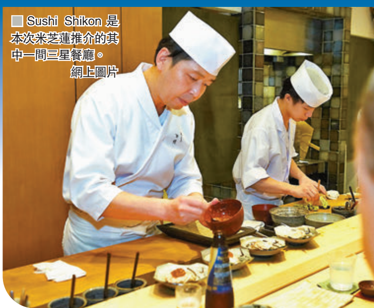
Sushi Shikon 是本次米芝蓮推介的其中一間三星餐廳。