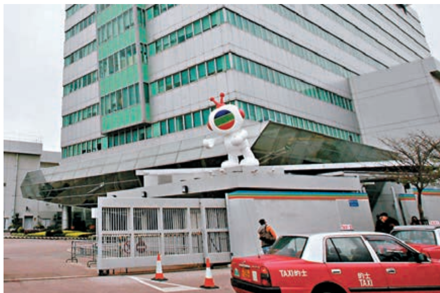
無綫電視宣佈最快年底裁減一成約350名員工，據了解技術部門較重災。資料圖片

會加快在內地，特別是大灣區的業務發展，並擴大營運設施及資源投放，包括在香港已有約900萬個登記用戶的myTV SUPER；TVB Anywhere亦正積極在東南亞和北美市場推出新產品和服務，加強拓展業務，相信可為被裁員工提供新的發展機會。