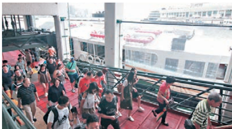
天星小輪向政府申請兩條航線每程票價加價3毫至5毫。

香港文匯報訊（記者 成祖明）受持續逾半年的修例風波影響，香港的經濟變得疲弱，市民因擔心人身安全而減少出外，公共運輸因此受到牽連，相繼申請加價維持收支平衡，暴力衝擊變相要市民「埋單」，苦了一批升斗小市民。其中，申請兩條航線加價16.5%的天星小輪表示，今年7月至10月期間，總乘客量較去年同期下跌近兩成，8月更下跌逾三成，預計乘客量難以於短期內回復過往水平，向政府申請該兩航線每程票價加價3毫至5毫。