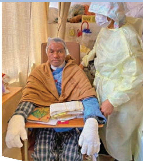
李伯的情況有所好轉。