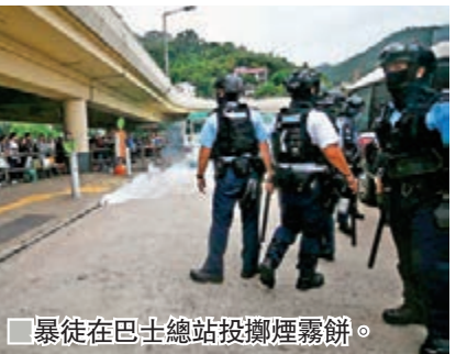
暴徒在巴士總站投擲煙霧餅。

其間有兩名女市民，疑出言阻止黑人在商場張貼標語及噴漆破壞的行為，即被黑衣人包圍指罵，其中一人更被人絆倒和搶去財物，另一人則被用黑漆噴黑面部和額頭侮辱。女事主稱：「我叫他們不要噴，之後那個人就來噴我面，就算我是支持還是不支持，他們都不應該噴污牆。」又稱：「我本身是帶着我的小朋友，佢哋嚇到了我小朋友。」 及至下午3時半左右，一批防暴警察