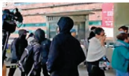
不少黑衣魔昨日在沙田發起「和你Shop」在新兵試練。

奉命到場驅散示威者，便衣警員及防暴警當場制服一男一女黑衣人，有暴徒企圖「搶犯」飛腳踢向警員的頭部。防暴警員要施放胡椒噴劑制止，其後再有防暴警察增援，再拘捕多名暴徒，惟大批圍觀者繼續指罵警員，部分防暴警察要手持胡椒噴劑戒備，其中一名被暴徒「私了」受傷女市民要送院救治。