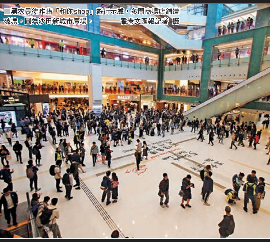
黑衣暴徒昨藉「和你shop」遊行示威，多間商場店舖遭破壞。圖為沙田新城市廣場。