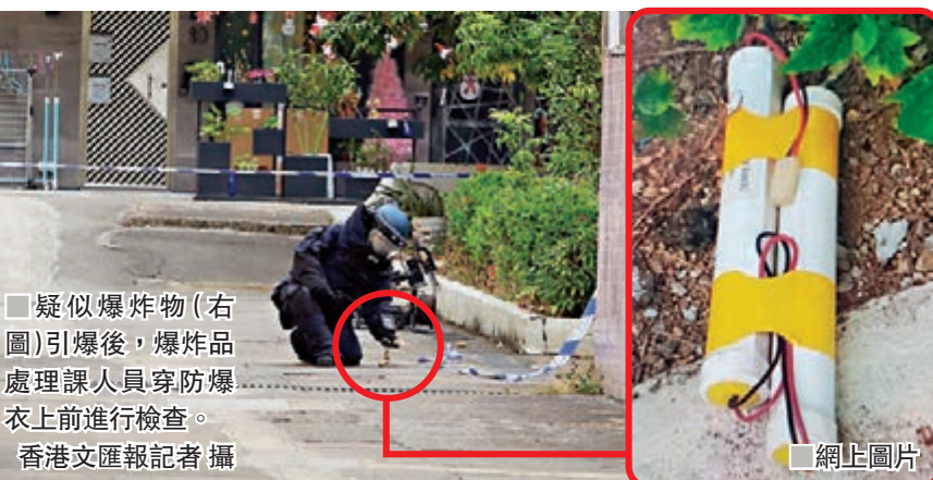
疑似爆炸物(右圖)引爆後，爆炸品處理人員穿防彈衣上前進行檢查。

香港文匯報訊(記者 蕭景源)香港接二連三揭發涉土製炸彈案，令普羅市民人心惶惶！昨午青衣大王下村有村民發現路邊花園有一個連有電線的可疑物，思疑是爆炸品，於是報警。警員趕至封鎖現場及疏散數十名村民，由爆炸品處理課(EOD)人員引爆未有發現任何炸藥，虛驚一場。惟事件反映出，近期黑魔「三五成群」各自製造炸彈罪，已在社區造成炸彈恐慌潮。