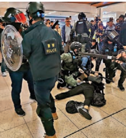
便衣警員及防暴警制服黑衣人。

香港文匯報訊(記者 蕭景源)黑衣暴徒昨藉「和你shop」遊行示威，除在沙田新城市廣場作出大肆破壞的非法行為外，又分在九龍灣德福廣場、葵芳的新都會商場、港島的太古城中心，以及將軍澳的Popcorn商場進行破壞，多間有中資背景和表明不支持暴力的店舖，均遭黑衣暴徒作出針對性破壞，商場其他店舖亦被迫落閘避禍，在德福廣場有市民不滿暴徒行為影相及出言指斥，一度被暴徒迫前企圖「私了」行私刑，幸及時由保安員護送帶離險境。入夜後部分示威者在旺角區街頭非法