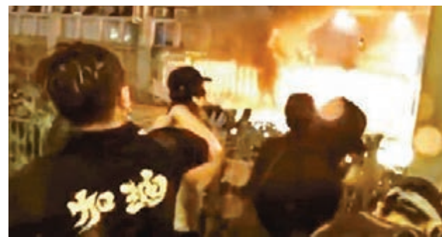
10月13日，「屠龍小隊」以「火雨」形式將燃燒彈投擲向旺角警署。資料圖片

據悉，大批「屠龍」成員落網後，另一個極端暴力團體「V小隊」將是警方下一個重點打擊目標。據了解，「V小隊」作風較為低調，但卻比「屠龍」更為暴力。今年8月30日，數名暴徒在葵涌警署附近用刀伏擊一名休班警察，事後有人在網上發表長文，詳述事發經過，自稱此事是「V小隊」所為，揚言該小隊的工作「就是專門對付警察」，並稱他們會到「海外受訓」，日後藉機潛回香港發動恐怖活動。