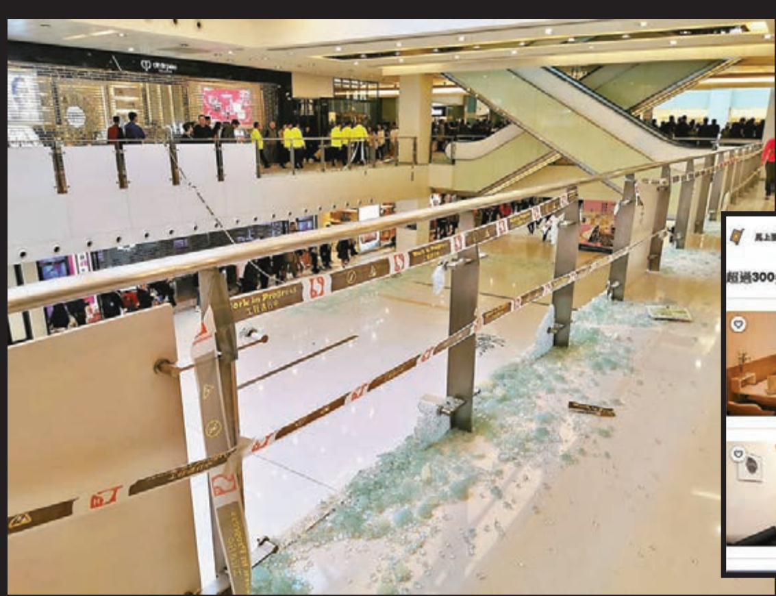
沙田新城市廣場昨日被大批黑衣魔破壞，欄杆上的玻璃被擊碎。