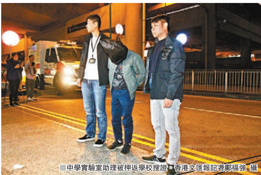
中學實驗室助理被押返學校搜證。

根據《香港法例》第二百零二條「刑事罪行條例」第五十三條，「導致相當可能會危害生命或財產的爆炸」罪是嚴重罪行，一經定罪可判處終身監禁。