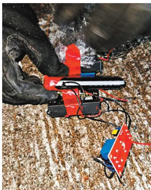
灣仔華仁書院遙控炸彈包括有手機、電路板、電池等。

【特稿】 隨着一宗宗真槍實彈、烈性炸藥、遙控炸彈案的曝光，揭示黑衣魔借遊行集會「殺警殺民」的野心越見猖獗，從喪心病狂的心態到付諸行動，不但利用各種渠道購置真槍實彈，亡命之徒「三五成群」各自製造炸彈也產生連綿效應，警方相信社區內有不少槍械或炸藥存在，危害程度令人擔憂。據警方檢獲的證物顯示，暴徒的真槍實彈和高級別的防彈衣，有機會分拆成零部件透過郵寄偷運來港，而打擊這類罪行要靠海關、警方等執法部門，以及市民的舉報多管齊下，方能有效遏止。警察公共關係科警司劉肇邦表示，警方一直積極進行情報收集，會以主動及適時