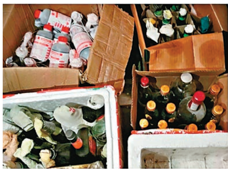
城大再發現大批汽油彈。

他表示有關院校一直未有提交失竊化學品清單，令警方無法確定有多少危險化學品落入黑衣魔手中，增添警方調查的難度，促請有關大學盡快提供資料協助警方加快調查工作。