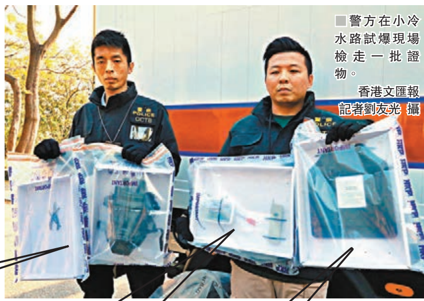
警方在小冷水路試爆現場檢走一批證物。