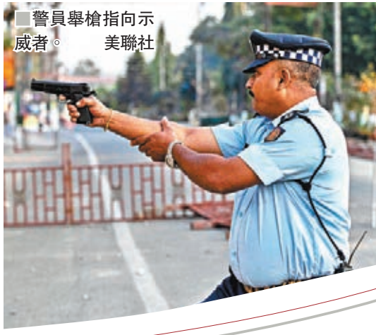
警員舉槍指向示威者。