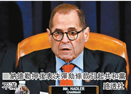
納德勒押後表決彈劾條款引起共和黨不滿。