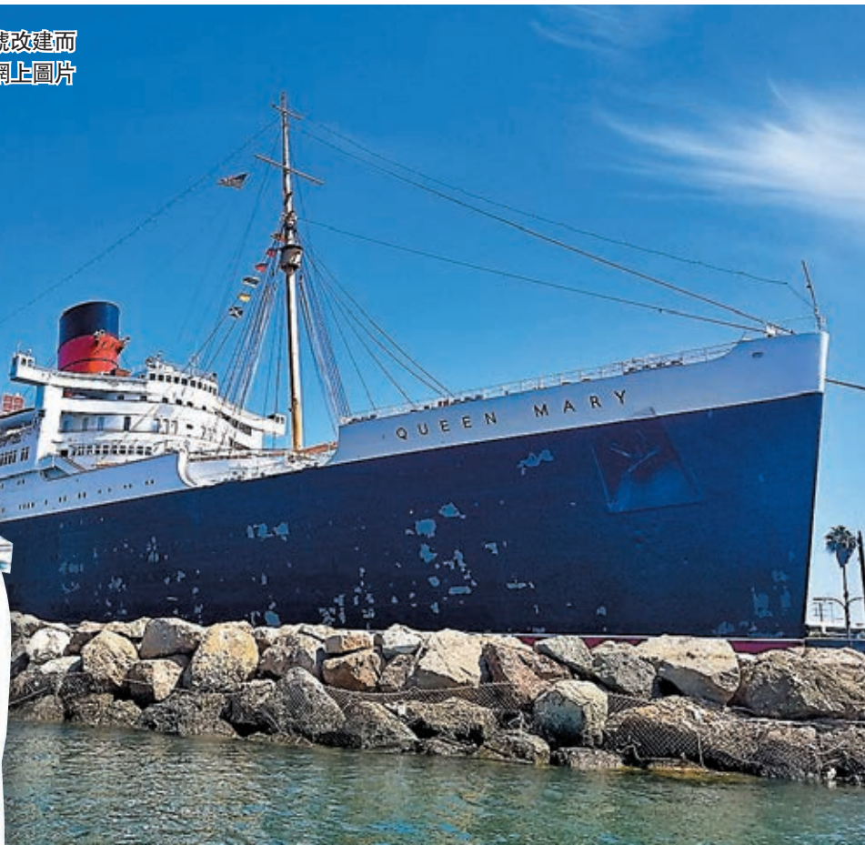
市議長認為可參考郵輪「瑪麗王后」號改建而成的海上酒店。