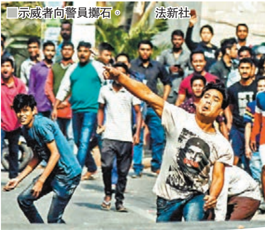
示威者向警員擲石。