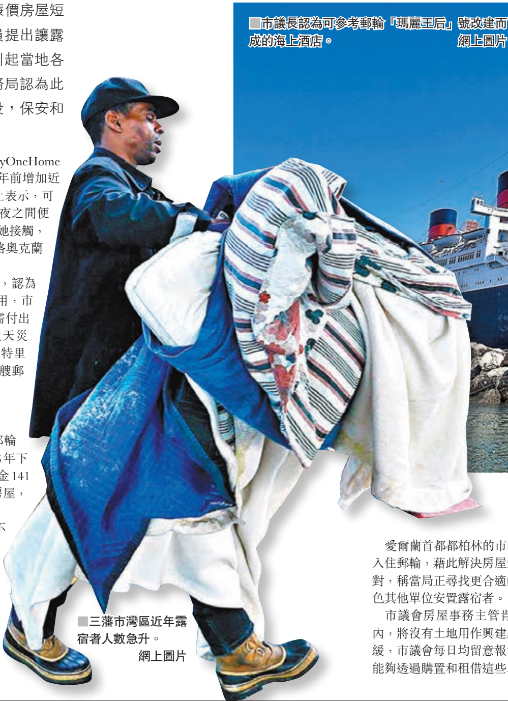
三藩市灣區近年露宿者人數急升。