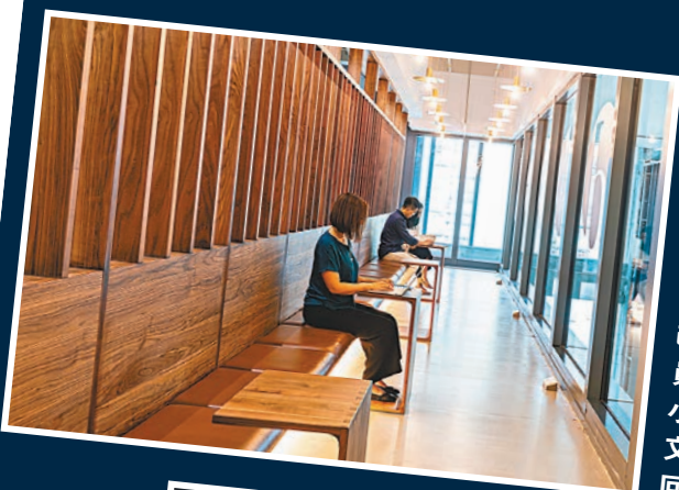
■辦公室桌子的大小隨時代進步而改變，部分員工只需較小空間來作文書處理或回覆電郵。