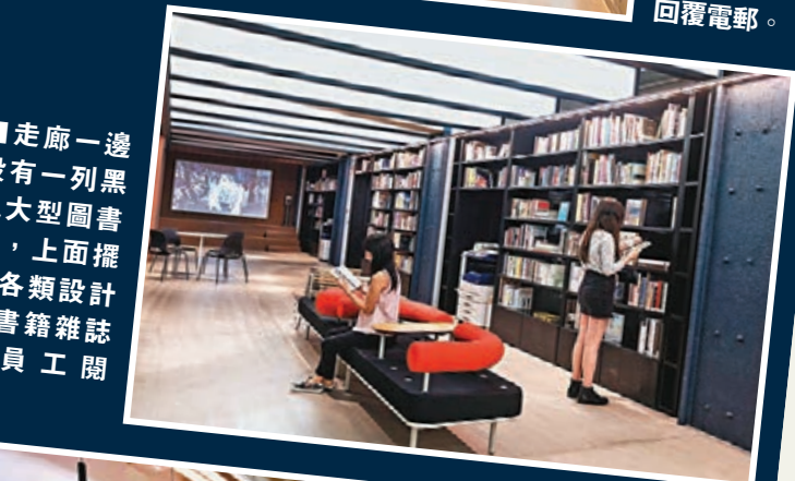
■走廊一邊設有一列黑色大型圖書架，上面擺放各類設計書籍雜誌供員工閱讀。