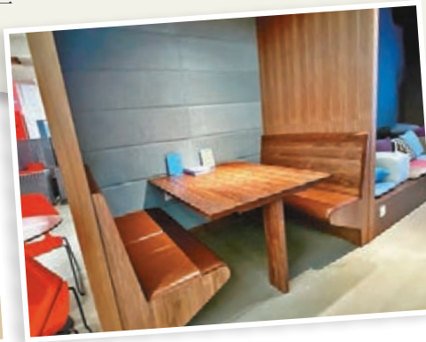
■銀幕旁設有卡座，可讓員工進行小組討論。