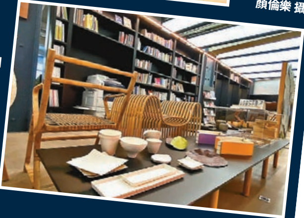
■走廊中間是公司的「小型展覽室」，用作擺放不同時期的設計作品。