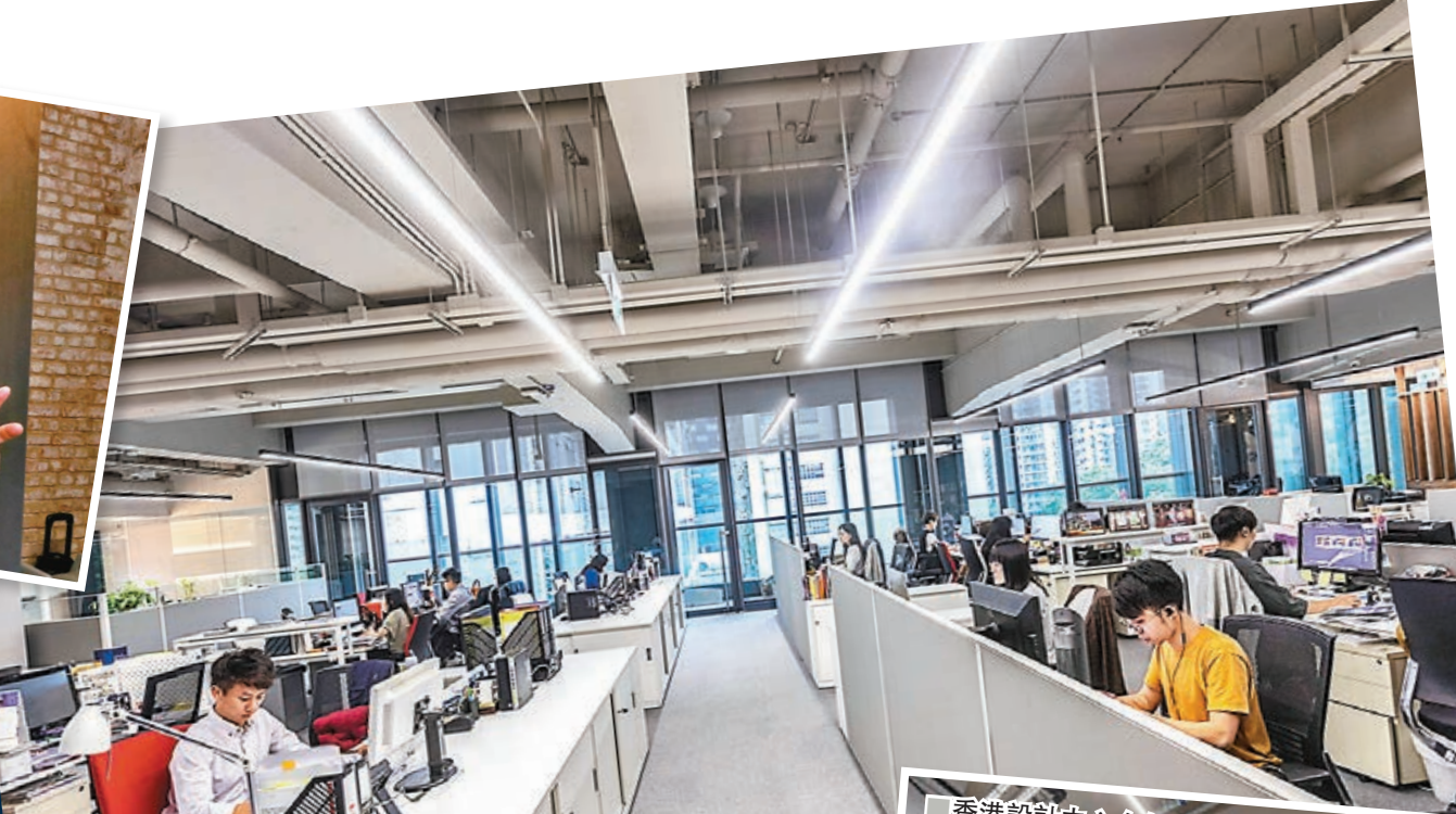
香港設計中心今年4月將辦公室搬到荃灣The Mills。