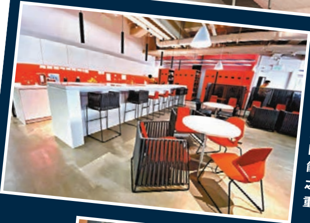
■「茶水間」空間闊落，不僅可沖咖啡，亦同時用作午飯，是員工之間連結的重要場所。