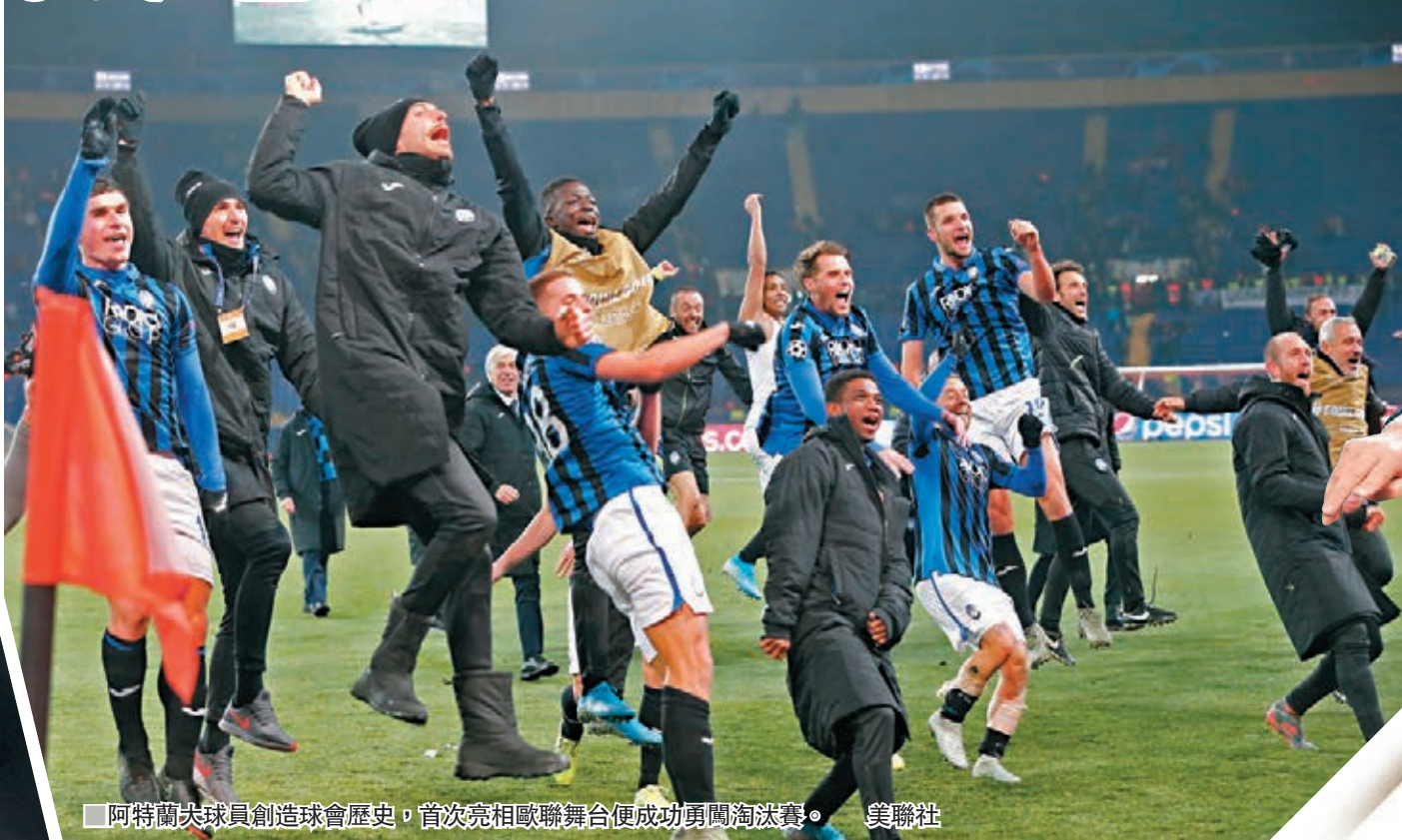
阿特蘭大球員創造球會歷史,首次亮相歐聯舞台便成功勇闖淘汰賽。