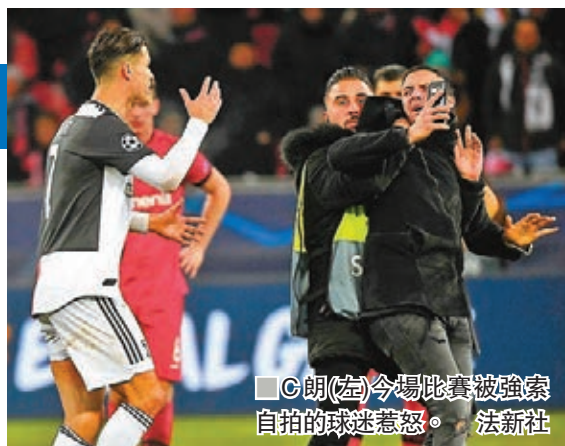
朗(左)今場比賽被強索自拍的球迷惹怒。

加斯柏連尼強調,自己一直堅信球隊能夠出線:「第4輪我們與曼城打成平手後,我就很有信心球隊最終能夠出線,那是一場非常關鍵的和局,尤其是當時薩克達與薩格勒布戴拿模亦打和3:3,好像是冥冥中為我們留下後來居上的機會。」這位61歲的前熱拿亞主帥續指,自己已經脫胎換骨,在淘汰賽將不懼任何對手:「我們沒有超級球星但非常團結,在比賽中顯示出決心和鬥志,我們已經不是小組第1輪那支阿特蘭大。球隊有了很大的進步和成長,無論面對任何對手我們均有信心去爭取勝利。」