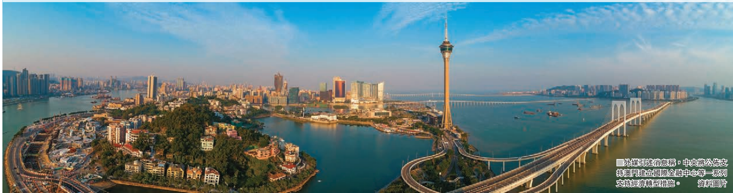
外媒引述消息稱，中央將公佈支持澳門建立國際金融中心等一系列支持經濟轉型措施。資料圖片