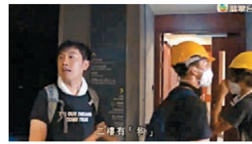
鄭松泰涉7月1日衝擊立法會，被控「串謀刑事毀壞罪」。資料圖片

陳志全的動議在功能組別中獲10票贊成，21票反對，地區直選中獲16票贊成，16票反對，未獲過半數支持而被否決。根據程序，容海恩提出譴責鄭松泰的議案將交由調查委員會處理。