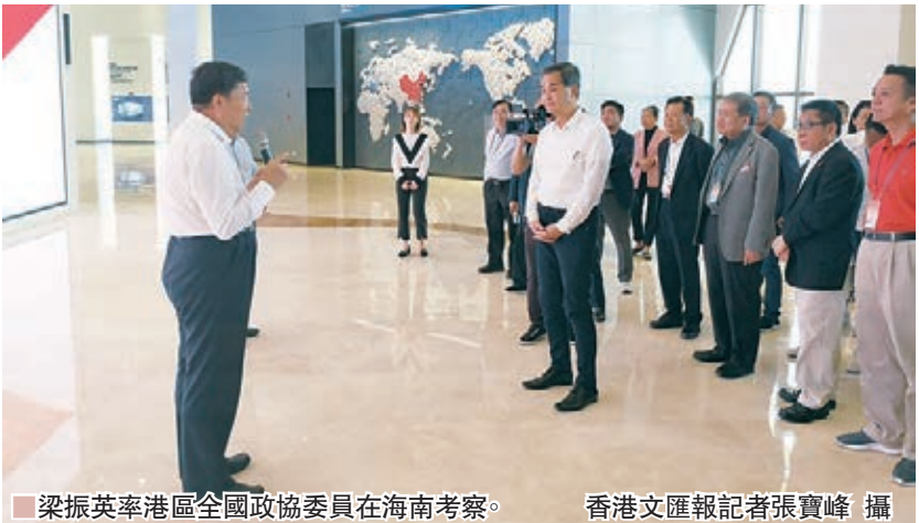
梁振英率領港區全國政協委員在海南考察。