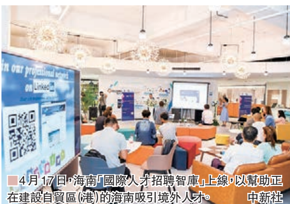
4月17日，海南「國際人才招聘智庫」上線，以幫助正在建設自貿區(港)的海南吸引境外人才。

海南省商務廳廳長陳希也表示，將由海南建設航空、海洋、生態等領域瓊港青少年遊學基地，鼓勵香港青少年赴瓊遊學，鼓勵香港青少年赴瓊開展義教、實習等各種形式交流活動。推進海南職業院校與香港職業教育培訓機構的合作，例如兩地學生交流、香港旅遊酒店類學生來瓊實習、師資培訓等。