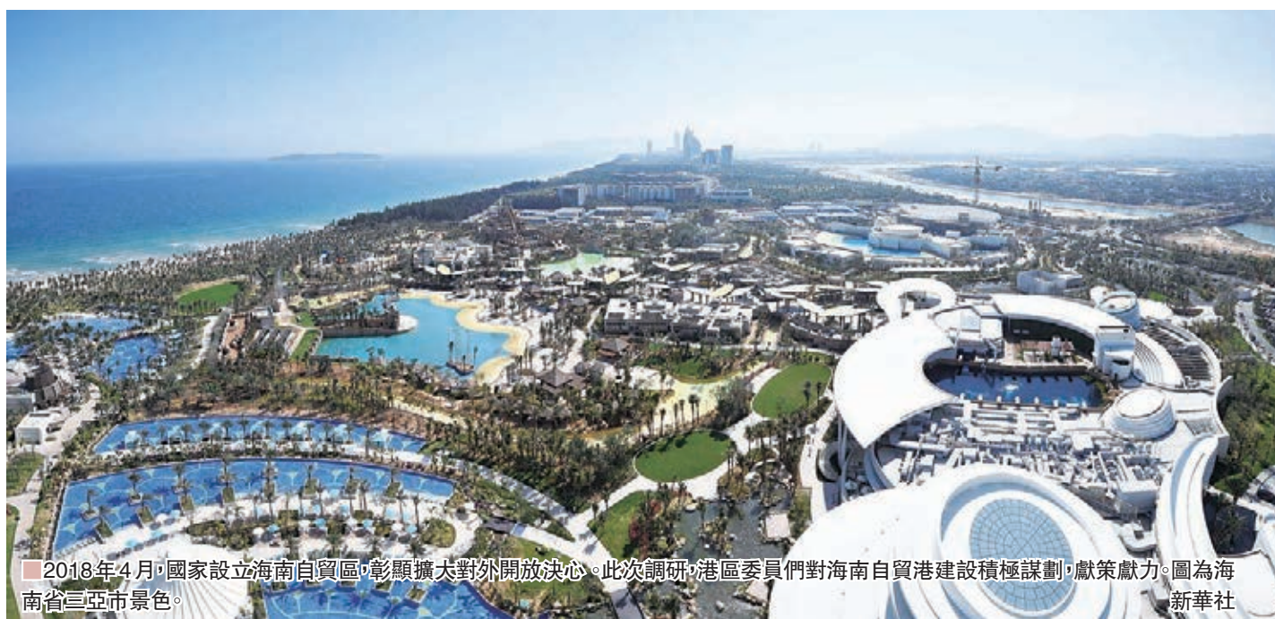
2018年4月，國家設立海南自貿區，彰顯擴大對外開放決心。此次研調，港區委員們對海南自貿港建設積極謀劃，獻策獻力。圖為海南省三亞市景色。

化旅遊+」產業，已經在海南投資長達12年之久。初到海南的時候，在當地政府的支持下，自己做了一項大型的土地生態修復工程，後來在上面慢慢發展出來很多新產業。事實證明，海南有非常好的土壤，香港人可以不斷在這裡追加投資。朱鼎健認為，香港是「一國兩制」下非常成功的自由貿易港，因此在海南建設自貿港