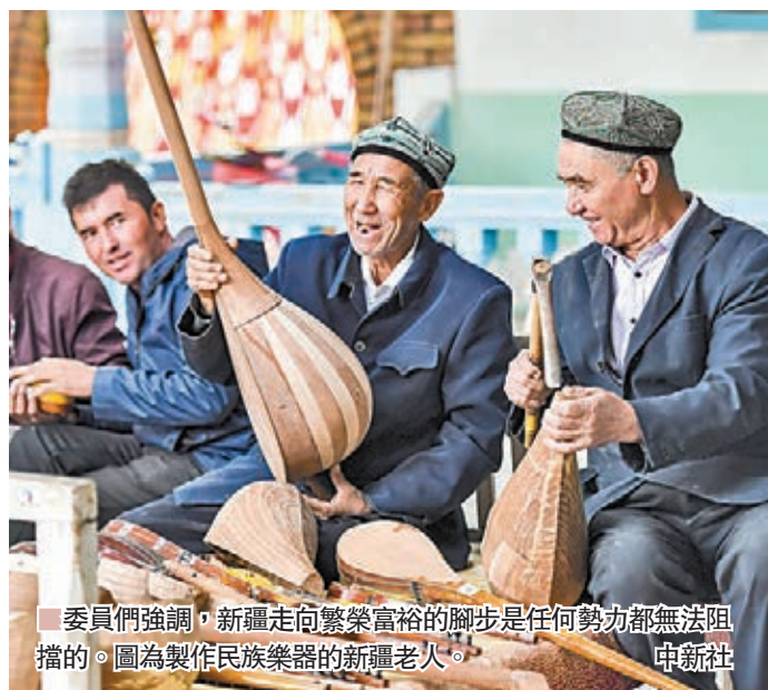
委員們強調，新疆走向繁榮富裕的腳步是任何勢力都無法阻擋的。圖為製作民族樂器的新疆老人。

委員們強調，中國內政不容干涉，真相不容歪曲，新疆去極端化和打擊恐怖主義的成果必將得到進一步鞏固和發展，新疆日益走向團結和諧、繁榮富裕、文明進步、安居樂業的腳步任何勢力都無法阻擋。