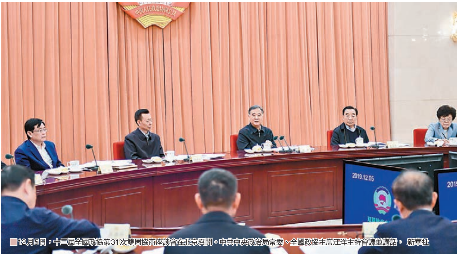
12月5日，十三屆全國政協第31次雙周協商座談會在北京召開。中共中央政治局常委、全國政協主席汪洋主持會議並講話。

全國政協副主席張慶黎、李斌、何維出席會議。全國政協副主席陳曉光作主題發言。12位政協委員和專家學者圍繞生態補償的資金投入、協調機制、社會參與、法治保障等建言資政，160多位委員在全國政協委員移動履職平台上踴躍發表意見。