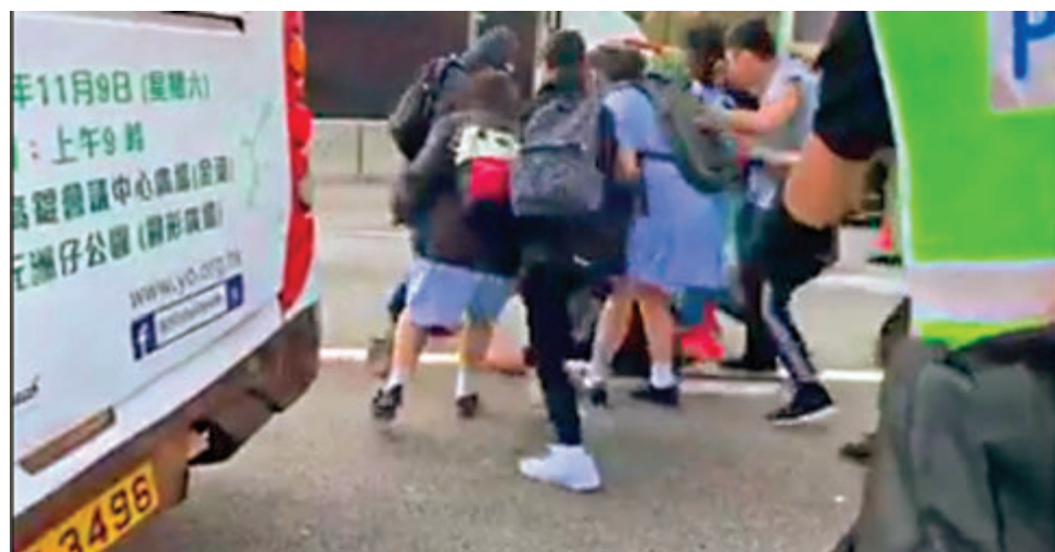
林鄭月娥指出,自6月反修例風波至今,差不多有超過300間中學都有個別學生被捕。圖為上月有穿校服女生夥暴徒「私刑」清路障司機。資料圖片

針對泛暴派不斷散播謠言,包括「中央將考慮改組特區政府問責班子」,企圖製造社會不安,林鄭月娥昨日坦言,過去數個月,一直有關於問責團隊改組的猜測和謠言,包括主要官員,也可能包括行政會議,但目前的首要任務是恢復香港的法律和秩序,確保香港在經濟和社會方面繼續向前發展,改組班子並非迫在眉睫的任務,並批評所有謠言和猜測對香港都沒有幫助,希望不要進一步傳播。