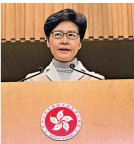
林鄭月娥表示,她已要求教育局局長對違規或被捕的老師嚴肅跟進。

被問及特區政府會否再回應所謂的「五大訴求」時,林鄭月娥重申,特區政府亦一直用心聆聽、了解市民在遊行中提出的訴求,並希望能夠做出讓市民感受到政府誠意的回應,但對違反法治精神、踐踏一些重要原則底線的「訴求」,特區政府都無法作出回應,譬如要求特區政府「特赦」,即釋放所有該事件中的被捕者。