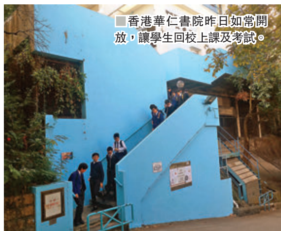
香港華仁書院昨日如常開放，讓學生回校上課及考試。