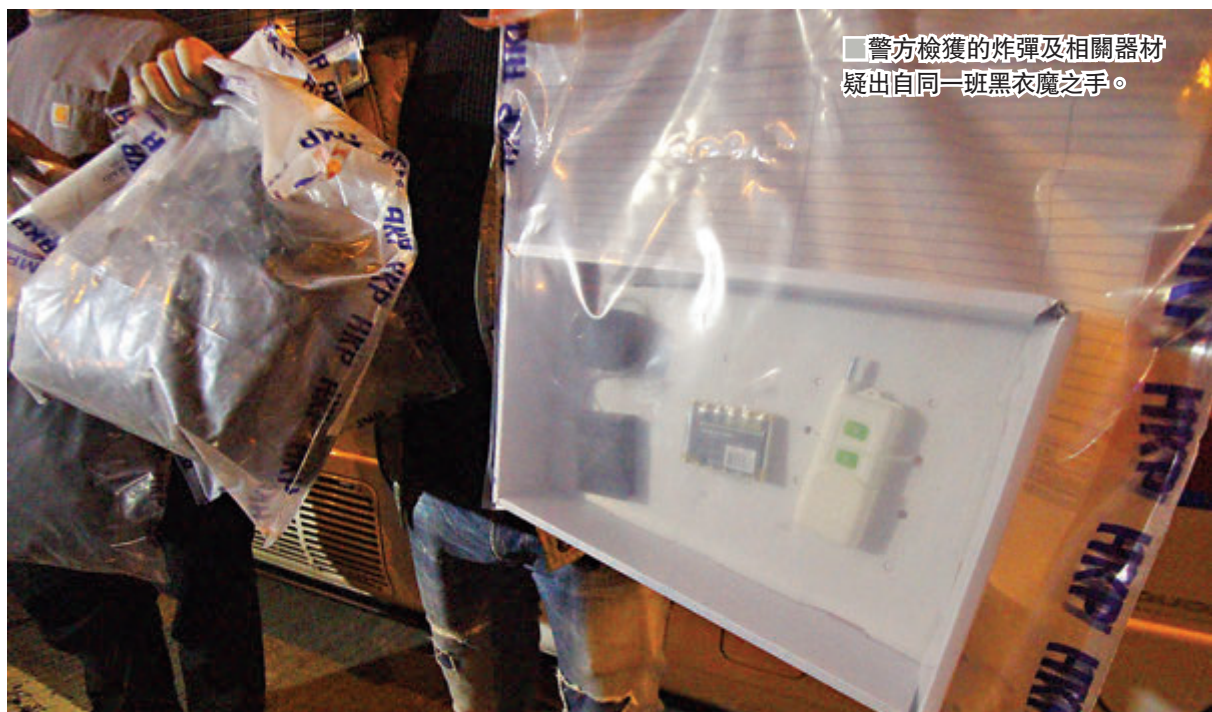
警方檢獲的炸彈及相關器材，疑出自同一班黑衣魔之手。

香港文匯報訊（記者 蕭景源）警方仍在深入追查前日在灣仔華仁書院發現的遙控炸彈，初步相信檢獲的炸彈是黑衣魔「屠龍小隊」所製，原定在剛過去的周日（8日）民陣的港島遊行中引爆，但為免隨身攜帶會意外炸死自己，遂事前收藏在華仁書院有蓋的斜坡上，準備遊行當日取出在鬧市中引爆，但由於警方當日及時拘捕「屠龍小隊」多名骨幹，起出半自動手槍和百發中空彈，令黑衣魔的爆炸計劃流產。另外，經警方拆彈專家解構，已證實為真炸彈及可被引爆，並懷疑這兩個炸彈與10月13日在旺角圖炸警車的遙控炸彈，出自同一班黑衣魔之手。