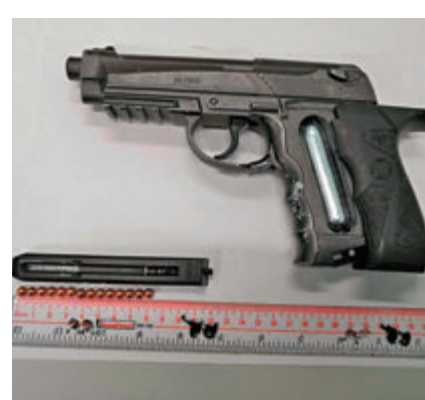
警員在沙田一名青年身上檢獲一支可發射鋼珠的仿製手槍。