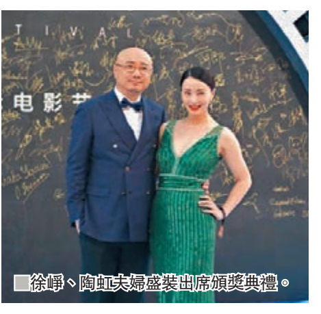
徐崢、陶虹夫婦盛裝出席頒獎典禮。

另外，即將過去的2019年中國電影獲得蓬勃發展，據「中國電影票房」APP數據顯示，截至12月6日22點41分，2019年中國內地電影票房已超600億元人民幣大關，較去年提前了24天。