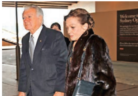
霍克(左)被指隱瞞迪龍(右)遭性侵犯一事。

澳洲已故前總理霍克的女兒迪龍近日在遺產爭奪案中，透露她1983年曾3次遭時任工黨國會議員蘭德尤強姦，但父親為免政治生涯受影響，竟要求女兒息事寧人。霍克是澳洲最受歡迎總理之一，今年5月逝世，這筆舊賬勢為其聲譽蒙上陰影。