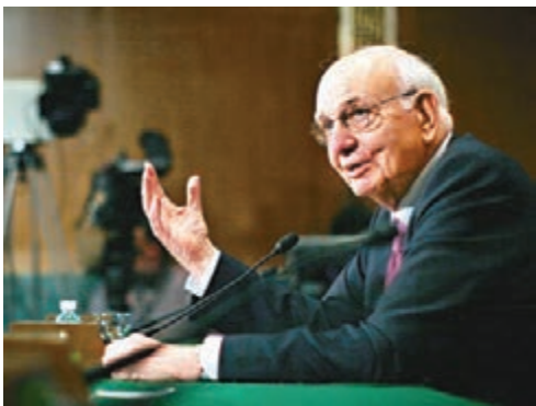
沃爾克前日病逝。

沃爾克成功擊退通脹，令美國政界開始明白到放任聯儲局獨立運作的重要性和好處。聯儲局前主席伯南克昨日回應沃爾克逝世時，形容沃爾克象徵了聯儲局的獨立性，「他開創了一個理念，就是要做一些政治上不受欢迎，但經濟上有必要的事。」 卸任後，沃爾克先後出任多個公職，包括協助大屠殺受害人家屬向瑞士銀行追討存款。金融海嘯後，奧巴馬邀請沃爾克出山籌劃金融改革建議，最終他提出所謂「沃爾克規則」，當中核心主旨是禁止銀行使用客戶存款進行投資活動的自營交易，藉此減少銀行系統性風險，防止「大得不能倒」的危機再次發生。「沃爾克規則」最終成為法例，並在2015年生效。 ■綜合報道