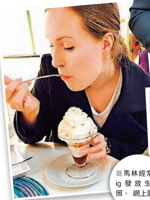
馬林經常在ig發放生活照。網上圖片