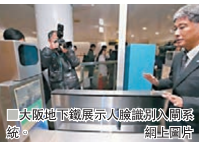
大阪地下鐵展示人臉識別入閘系統。