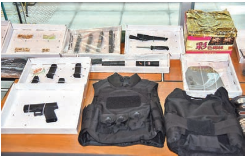
警方前日起獲疑犯武器。

香港文匯報訊（記者 葛婷）前日港島暴力遊行前夕，警方情報顯示有暴徒企圖在遊行期間用真槍「殺人嫁禍」，警方於當日凌晨先發制人搜查全港多個目標地點，起出一支手槍、逾百發子彈、利刀及爆竹等致命武器，拘捕11名男女。其中5名涉案男子已被落案控