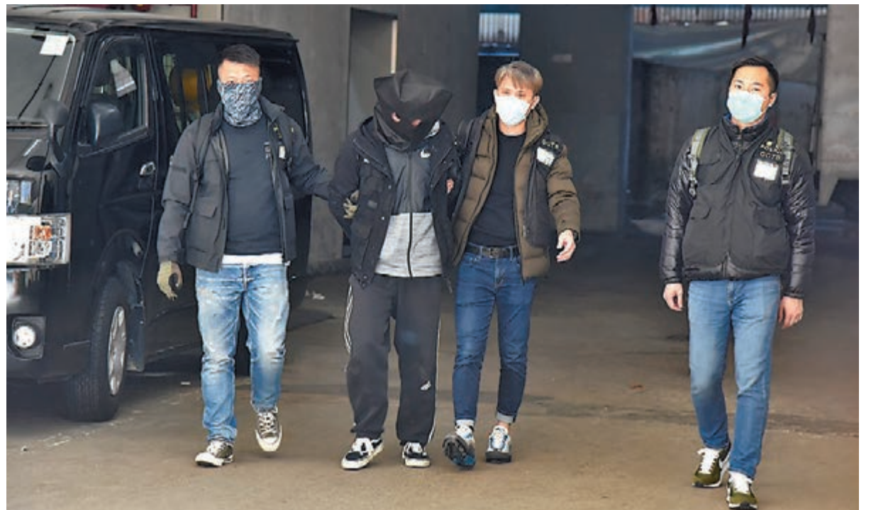
「O記」探員日前在荃灣帶走一名男性疑犯扣查。資料圖片

以串謀有意圖而傷人、無牌管有槍械及彈藥，以及管有攻擊性武器等罪，昨午被押往東區裁判法院提堂，其間法庭保安明顯加強，大批衝鋒隊警員全副武裝擊槍戒備。控方透露有被告曾商量「試槍」和如何用槍射人。裁判官林子勤將案件押後至明年2月18日再訊，當中3人還押懲教署看管。