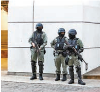
荷槍實彈的警員昨在東區裁判法院外戒備。

3人避彈衣跟身就寢 控方續指，警方在灣仔克街的住宅單位內拘捕7人，包括提堂的5名