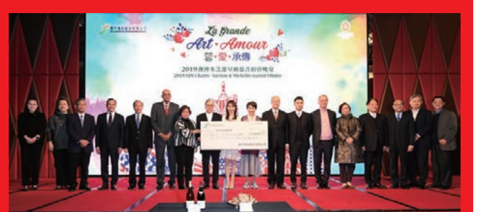
澳博及澳博控股董事局成員將善款支票遞交澳門十間慈善機構的代表。

喜迎澳門回歸祖國二十周年之際,澳門博彩股份有限公司日前假澳門新葡京酒店宴會廳舉行「藝·愛·承傳」2019澳博米芝蓮星級慈善拍賣晚宴。慈善拍賣共籌得善款二百八十六萬八千澳門元,悉數捐贈澳門十間慈善機構。今年亦是澳博連續第十三年舉辦此城中盛事。