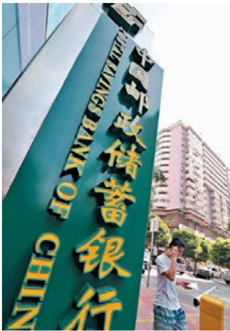
郵儲行公告稱,其控股股東中國郵政集團公司計劃自12月10日起12個月內擇機增持其股份。資料圖片

發行文件顯示,發行人授予聯席主承銷商不超過初始發行數量15%的超額配售選擇權(或稱「綠鞋」),若綠鞋全額行使,則發行總股數將擴大至59.48億股,約佔發行後總股本的比例為6.84%(超額配售選擇權全額行使後)。