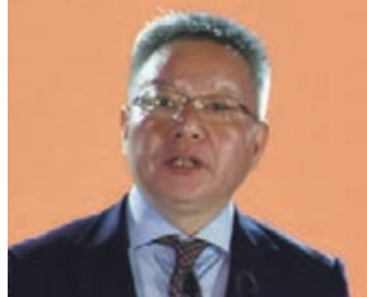
海南省委副書記、省長沈曉明致辭

沈曉明致辭時介紹,當前海南可以用「四個好」來概括,一是發展環境好;二是政策預期好;三是開局起步好;四是社會反響好。當前海南全省有僑企1,500多家,實際利用僑資200多億元,鄉親們為海南的教育文化、醫療衛生、農村交通建設等捐款,累計超過10億元。開放、繁榮、和諧、安寧的故鄉,是海外遊子的堅強後盾,廣大瓊籍海外鄉親,是海南連接世界的重要紐帶,也是海南自貿港建設的重要力量。海南自貿港建設需要930萬海南人民的參與,也需要390萬瓊籍海外鄉親的參與,做好930萬和390萬的加法,是推動海南自貿港建設的重要關鍵之一,他希望各位鄉親一如