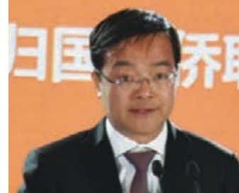
中國僑聯副主席齊全勝致辭