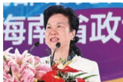
海南省委統戰部常務副部長、海南海外聯誼會常務副會長、海南省政協港澳台僑外事委員會主任王瑋珠致辭。