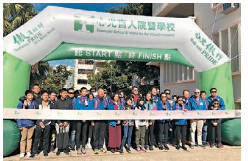
心光學校舉行「2019心光傲行」步行籌款活動。

香港文匯報訊（記者 文森）香港約有17.5萬名視障人士，其中完全失明者約有7,800名。心光盲人院暨學校是現時香港唯一的視障學校，該校為失明及弱視人士提供教育及住宿服務。昨日心光學校舉行「2019心光傲行」步行籌款活動，籌集款項將用以支持學校繼續發展視障人士服務。