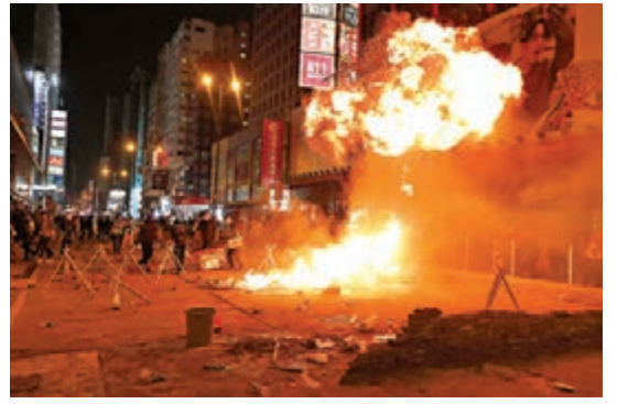
暴徒縱火，黑色病毒肆虐香江。

香港的健康岌岌可危，維護香港繁榮穩定是每一個人的責任。我們不怕，我們不會躲。香港警察始終挺在前線，越來越多市民看清了病毒的真面目，駐港部隊解嚴也站出來合力清理路障；還有背後