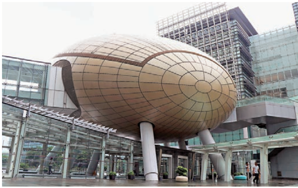
香港科學園「金蛋」。資料圖片

香港文匯報訊（記者 高俊威）特區政府的「公營機構試用計劃」自2011年推出以來，已資助200多個項目，惠及逾140個公營機構，資助額逾4億元。為推動香港創新科技的發展，進一步促進研發成果實踐化及商品化，創新及科技局局長楊偉雄昨日發表網誌指出，由明年首季起，將擴大計劃的資助範圍，由現時創新及科技基金資助的研發項目及科學園、數碼港的企業，擴大至全港所有進行科研的公司。