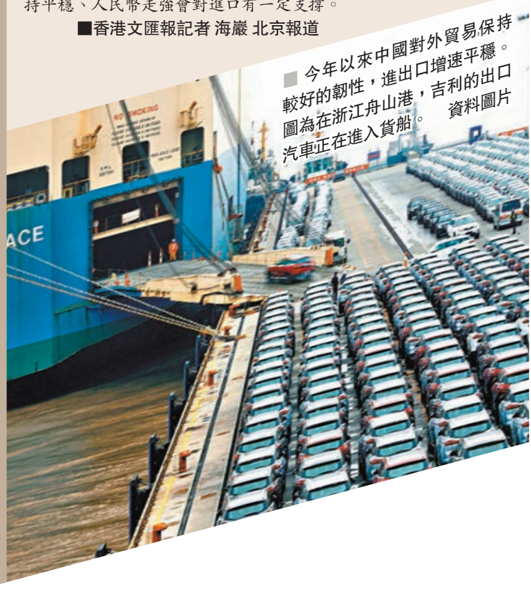
今年以來中國對外貿易保持較好的韌性，進出口增速平穩。圖為在浙江舟山港，吉利的出口汽車正在進入貨艙。資料圖片