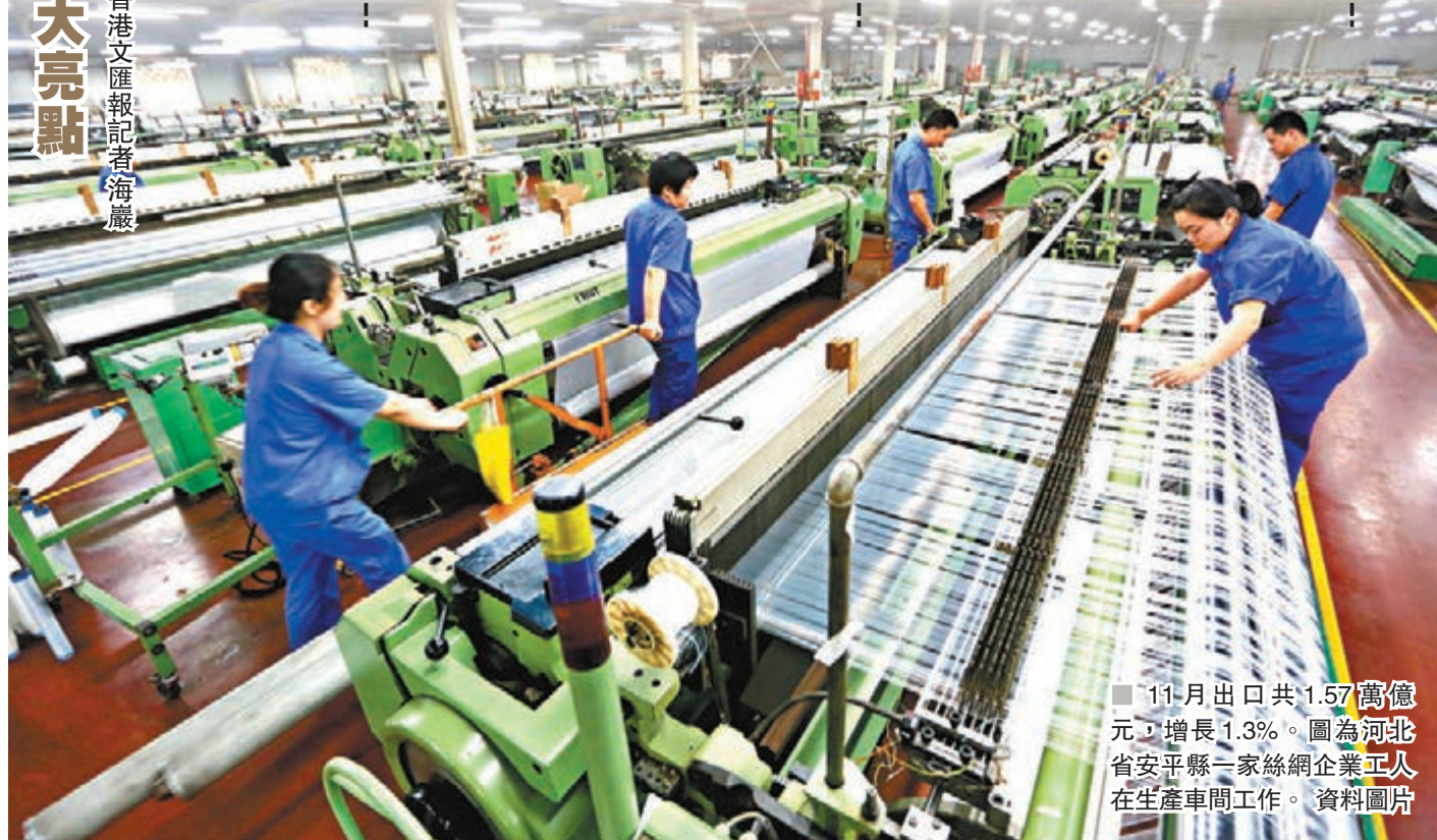
11月出口共1.57萬億元，增長1.3%。圖為河北省安平縣一家絲綢企業工人在生產車間工作。資料圖片

民企成第一大外貿主體 前11個月民企進出口額同比增長 10.4% ，高出整體增速8個百分點，其中出口增速高達 12.4% ，佔中國外貿比重達 42.5% 。