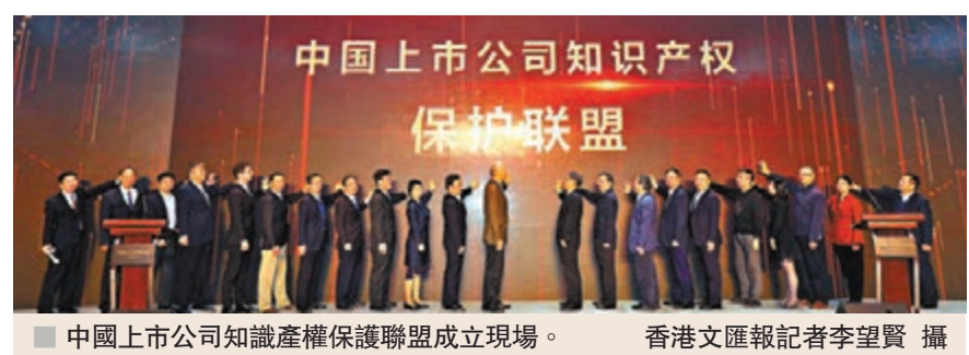
中國上市公司知識產權保護聯盟成立現場。

大會還宣佈將籌建「中國知識產權50人論壇」，旨在以全球化的思維聚集國內外跨領域、跨學科、跨國界的知識產權專家學者和研究成果，為新時代全面深化改革和中國參與全球經濟治理等重大問題獻策獻力。300餘位專家學者與企業代表出席大會。