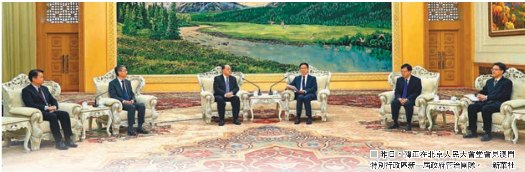
■昨日，韓正在北京人民大會堂會見澳門特別行政區新一屆政府管治團隊。 新華社

香港文匯報訊 據新華社報道，中共中央政治局常委、國務院副總理韓正昨日在人民大會堂會見了澳門特別行政區候任行政長官賀一誠率領的來京接受任前培訓的新一屆政府管治團隊。