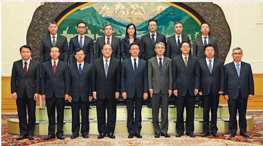
■韓正希望新一屆政府管治團隊在賀一誠行政長官的領導下，全面準確貫徹「一國兩制」方針。 新華社

賀一誠等匯報了澳門特別行政區新一屆政府的施政思路，表示將按照中央要求，恪盡職守，積極作為，推進具有澳門特色的「一國兩制」實踐取得新成績。