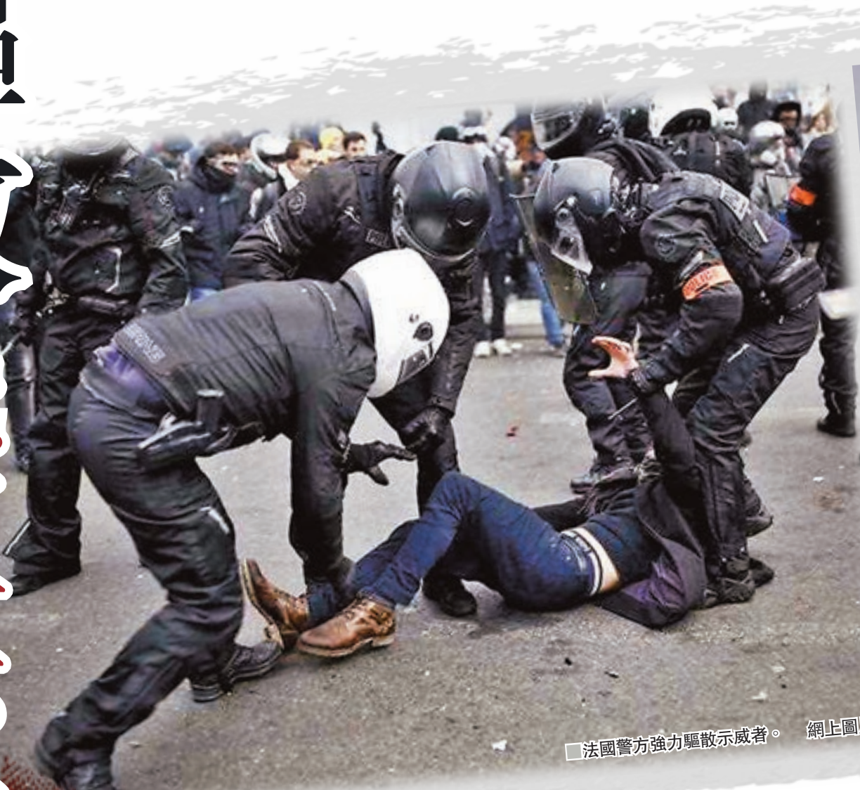
法國警方強力驅散示威者。

然而值得注意的是，現在西方國家都爭相搶佔道德高地，當暴力行為並非發生在本國時，西方社會都習慣聚焦他國警方的行徑，但當事情是發生在本國時，則視其為對暴力行為的自然反應，理所當然，難道這不是雙重標準嗎？