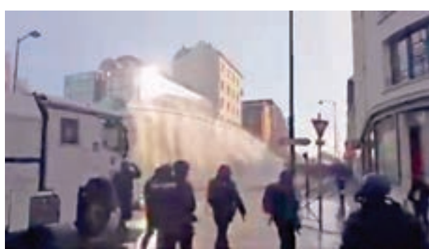
警方出動水炮車。