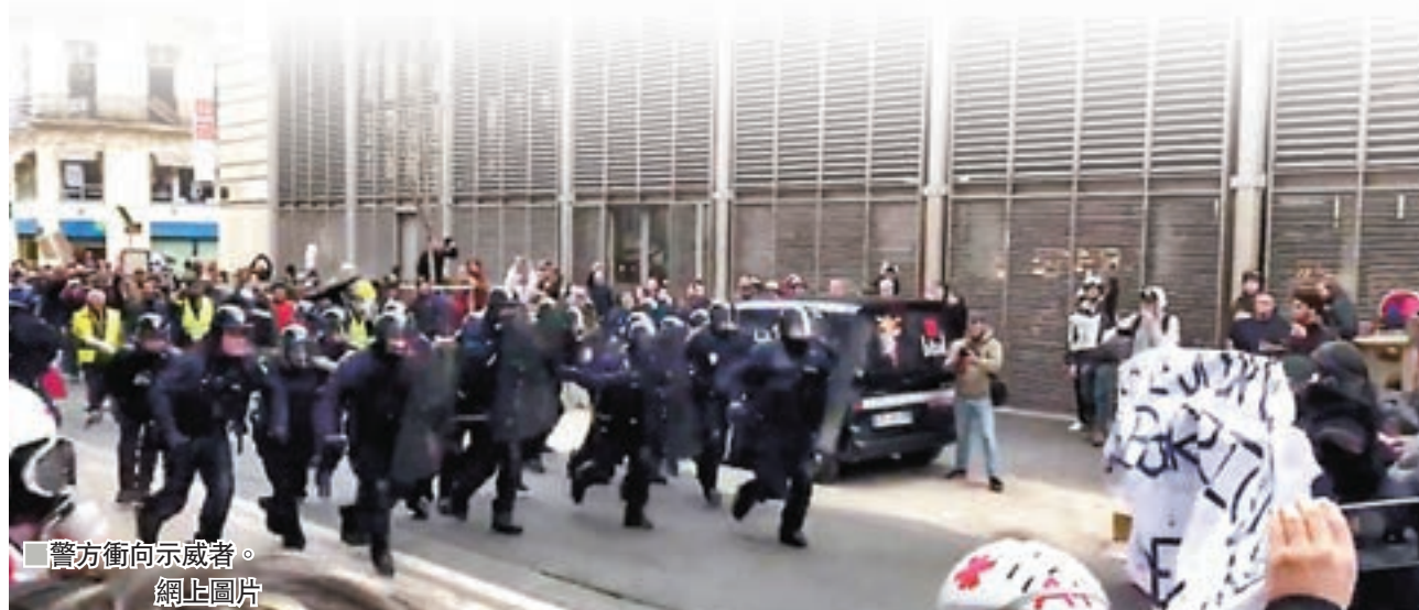
警方衝向示威者。