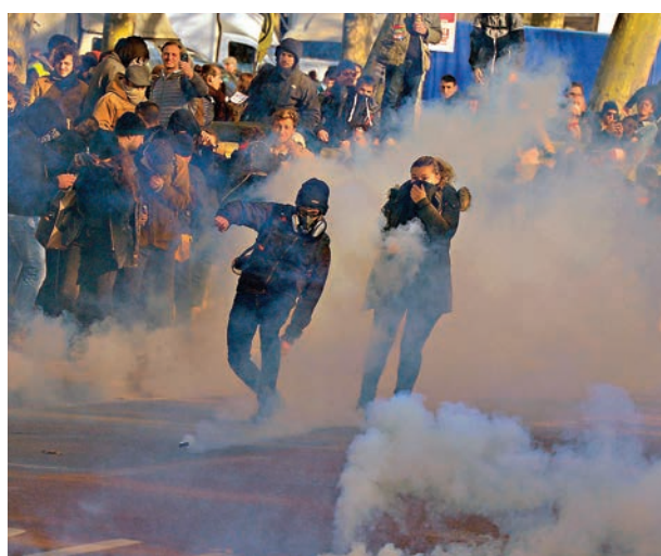
示威者將催淚彈擲回警方防線。

政治學家科特雷斯則指，罷工行動演變成暴力衝突，將令示威者失去公眾支持，亦會打擊政府的民望，導致雙方皆輸，「長遠而言，唯一的贏家只會是極右派」。 ■綜合報道