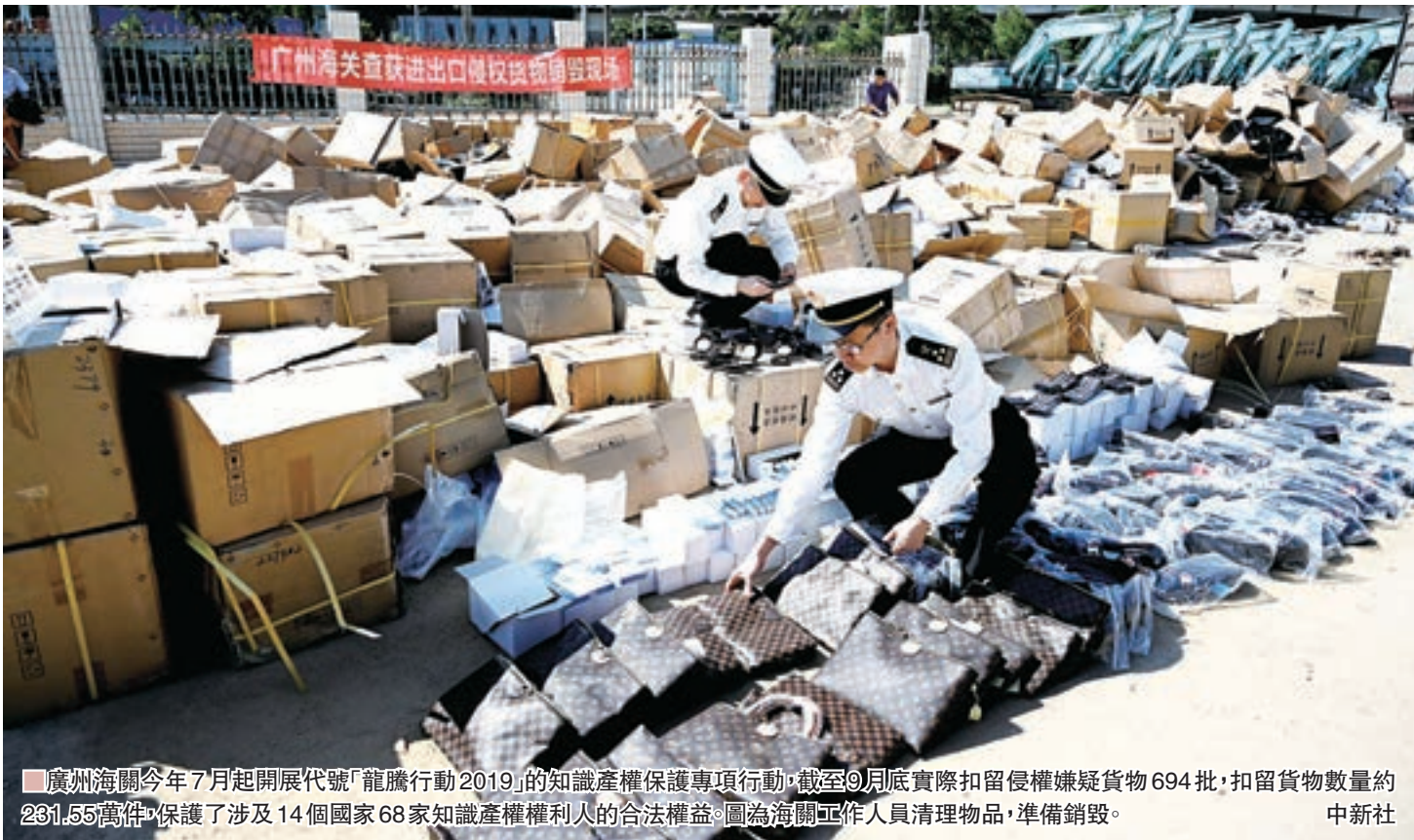
廣州海關今年7月起開展代號「龍騰行動2019」的知識產權保護專項行動。截至9月底實際扣留侵權嫌疑貨物694批，扣留貨物數量約231.55萬件，保護了涉及14個國家68家知識產權權利人的合法權益。圖為海關工作人員清理物品，準備銷毀。

為確保各項工作要求有效落實，意見明確，地方各級黨委和政府要落實知識產權保護屬地責任，各地區各部門要加大对知識產權保護資金投入力度，並將知識產權保護績效納入地方黨委和政府績效考核和營商環境評價體系。