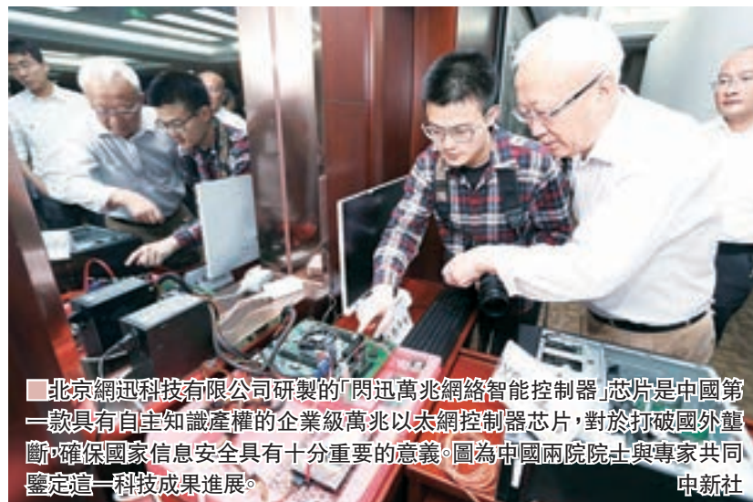
北京網訊科技有限公司研製的「閃迅萬兆網絡智能控制器」芯片是中國第一款具有自主知識產權的企業級萬兆以太網控制器芯片，對於打破國外壟斷、確保國家信息安全具有十分重要的意義。圖為中國兩院院士與專家共同鑒定這一科技成果進展。

目前，既精通法律、又了解知識產權、同時還懂信息技術及其應用的複合型人才十分短缺。「網絡環境下知識產權保護工作具有很強的專業性，對司法人員的知識結構和專業能力要求很高。」全國政協委員王堅認為，加快培養複合型人才，已成為網絡環境下的知識產權保護工作的迫切需要。