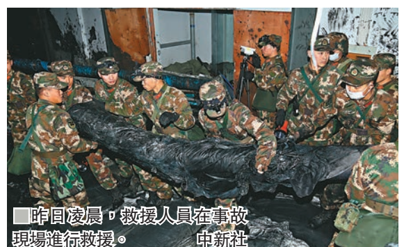
昨日凌晨，救援人員在事故現場進行救援。 中新社

生命探測儀等設備投入現場挖掘處置。市衛生健康局啟動醫療急救應急預案，開通綠色通道，迅速組織調集包括浙江省人民醫院等專家團隊在內的近百名醫務人員參加救治工作。」海寧市政府相關負責人說。 據悉，浙江省委省政府高度重視事故的處置和善後工作。省、市、縣各級政府正全力以赴做好幾方面工作：一是全力救治傷員，最大限度減少人員傷亡。二是迅速開展家屬情緒疏導及善後工作。三是立即啟動水體污染防治應急預案。強化對污染物截留，持續對相關河道水質進行監測，密切關注水質變化。四是全面排查安全生產隱患，特別針對全市印染企業及類似高危行業進行全覆蓋逐戶排查整改。五是加快事故調查工作，根據調查結果依法嚴肅處置事故責任人。