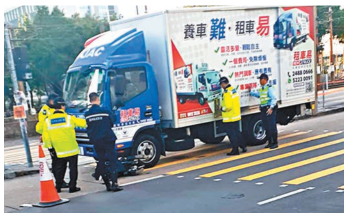
肇事貨車撞倒輪椅翁後停在路中,上址部分交通燈仍未修復。fb「Brother Sharp Fan Club」圖片

香港文匯報訊(記者 蕭景源)黑衣魔四處破壞交通燈終害死無辜市民。天水圍天瑞路多組交通燈因遭黑衣魔破壞,一直無法完全修復,行人和司機要「靠估」。一名以電動輪椅代步的老翁,昨日下午在行人輔助線橫過馬路時,一輛貨車疑收掣不及,當場將老翁撞飛到數米外昏迷,送院搶救不治。警方以涉嫌危險駕駛引致他人死亡,拘捕肇事貨車司機。有街坊指,區內交通燈頻遭黑衣魔破壞,且破壞總比修復快,終釀成是次慘劇,並批評公共設施因當選的泛暴派發起的暴力示威引起,他們必須「找數」。