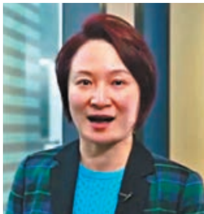
李慧琼強烈要求政府在明年立法會選舉前落實改善選舉措施。

香港文匯報訊(記者 文根茂)區議會選舉已告一段落,但過程中暴露的選舉不公現象仍未解決。民建聯主席、立法會議員李慧琼昨日在facebook發表視頻表示,在是次選舉期間,民建聯的候選人不斷被暴力滋擾,選民亦投訴投票、點票、監票安排存在諸般問題,但有關方面至今仍未提出相應的應對措施。她要求特區政府啟動檢討,並在明年立法會選舉前落實改善措施,以免不公現象繼續打擊選舉公信力。