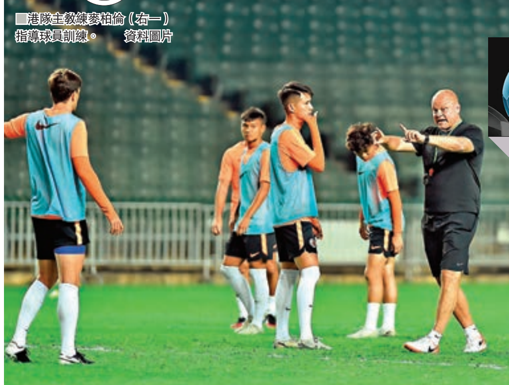
港隊主教練麥柏倫(右一)指導球員訓練。資料圖片