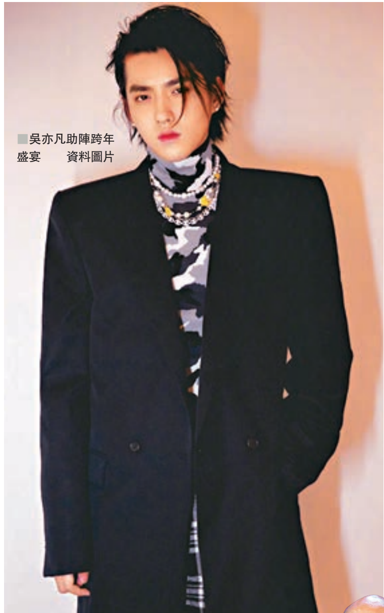
吳亦凡助陣跨年 盛宴 資料圖片