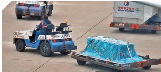
高以翔遺體運返台灣。

另有傳，高以翔在好友黃景瑜力邀下擔任嘉賓，現在痛失摯友令黃景瑜情緒大受影響。黃景瑜前晚出席品牌活動，這是悲劇發生後他首次現身公開活動，有網友公開現場圖片，可見黃景瑜全無笑容，面容憔悴，明顯消瘦，離開活動現場時不發一語。網友留言：「今天的哥哥感覺好憂傷，讓我看着心疼，哥哥真的瘦太多了，整個人瘦了一圈吧。」粉絲紛紛表示擔心黃景瑜的狀態，希望他能早日平復心情。