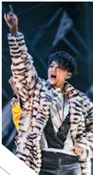
黃子韜任演唱嘉賓。 資料圖片

香港文匯報訊（記者 胡若璋 廣州報道）踏進12月，意味着跨年進入倒計時。開創跨年演唱會先河的湖南衛視跨年晚會今年移師海口舉辦，將在可容納3萬多名觀眾的露天場館打造戶外齊嗨的跨年盛宴。記者獲悉，今年湖南衛視的跨年晚會將由慢綜藝王牌團隊陳歆宇工作室操刀，該團隊曾負責過4屆跨年晚會。在這次跨年演唱會首場新聞發佈會現場，晚會監製夏青揭曉首輪6位演唱嘉賓陣容，分別是黃子韜、騰格爾、劉濤、王一博、吳亦凡、張碧晨。夏青指出，跨年陣容將後續陸續揭曉，但可以肯定的是，湖南衛視跨年陣容一定會讓驚喜如約而來。