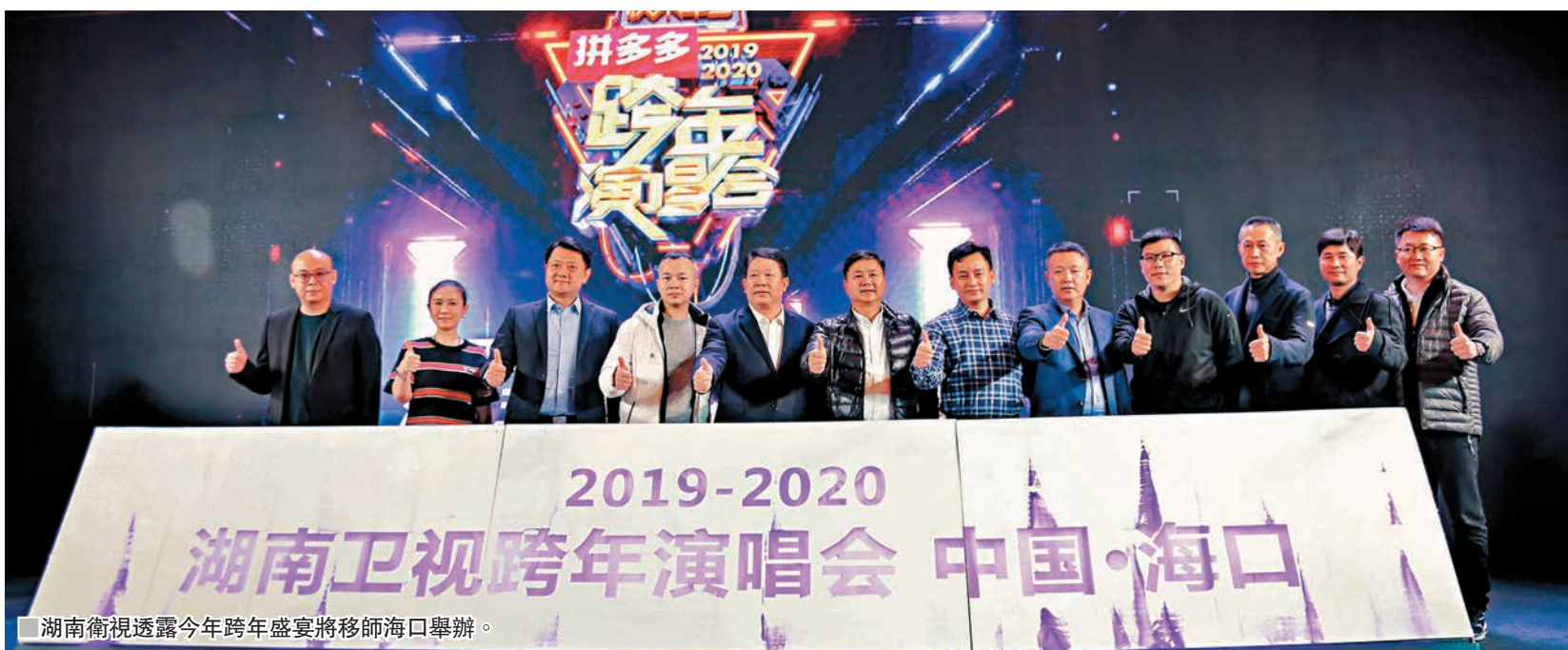
湖南衛視透露今年跨年盛宴將移師海口舉辦。