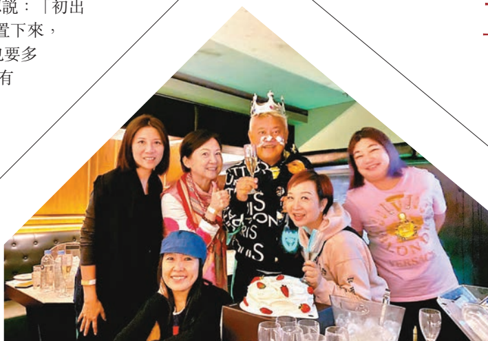
秀姑偕一眾好友和叻哥慶生。