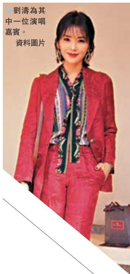
劉濤為其中一位演唱嘉賓。 資料圖片