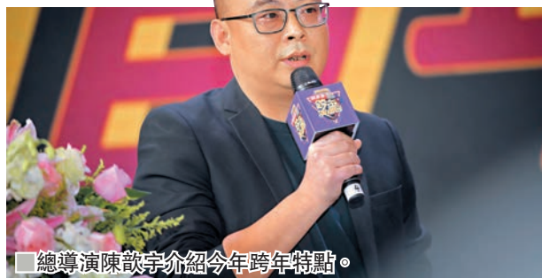
總導演陳歆宇介紹今年跨年特點。