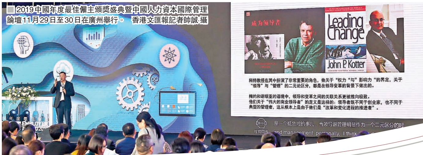
2019中國年度最佳僱主頒獎盛典暨中國人力資本國際管理論壇11月29日至30日在廣州舉行。