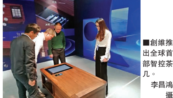
■創維推出全球首部智控茶几。

香港文匯報訊（記者 李昌鴻 深圳報道）創維數碼(0751.HK)昨在深圳舉行簽約儀式，推出全球首款具有語音、觸控等多種智控方式，並具有人性化體驗的智控中心——創維智控茶几，通過5G、物聯網、互聯網等將家裡所有家電聯網實現語音控制，助力人們實現理想的智能家居生活。發佈會上，創維數碼與保利生態、越秀地產和香港皇朝傢俬等簽約合作，將為他們提供智慧家居融入其地產和傢俱中。