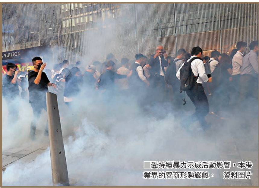
受持續暴力示威活動影響，本港業界的營商形勢嚴峻。

香港文匯報訊（記者 蔡競文）香港總商會昨公佈的《商業前景問卷調查》結果顯示，受近期示威活動和中美貿易戰的影響，本港業界的營商形勢嚴峻，近半（49%）受訪企業表示，與去年同期相比，他們在今年首10個月的營業額錄得跌幅，另有32%表示營業額維持穩定及13%錄得增幅。37%的受訪者預期未來12個月營業額持續下跌，有34%認為會維持穩定，只有13%預料營業額會增加。