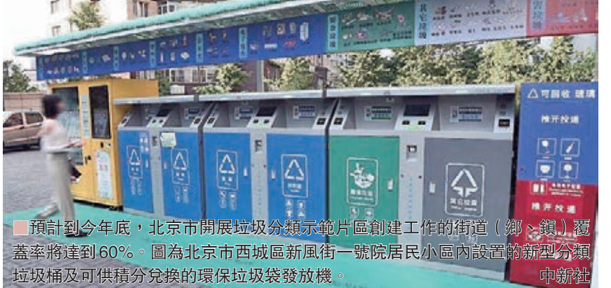
預計到今年年底，北京市開展垃圾分類示範片區創建工作的街道(鄉、鎮)覆蓋率將達到60%。圖為北京市西城區新風街一號院居民小區內設置的新型分類垃圾桶及可供積分兌換的環保垃圾袋發放機。

參考提案提出的建議，北京市城市管理委開展了示範片區創建工作。預計到今年年底，全市開展垃圾分類示範片區創建工作的街道(鄉、鎮)覆蓋率將達到60%。此外，市城管委還制定了《北京市生活垃圾分类工作行動方案》及配套實施辦法，逐步在黨政機關、事業單位、社團組織、公共場所、經營性場所全面開展垃圾分類。實施居住小區垃圾分類，細化標準與容器設置，明確投放模式與收運要求，對大件垃圾與裝修垃圾存放、運輸與處置提出要求。落實垃圾收集運輸企業主體責任，各類垃圾實施分類收集與運輸，杜絕「混裝混運」。