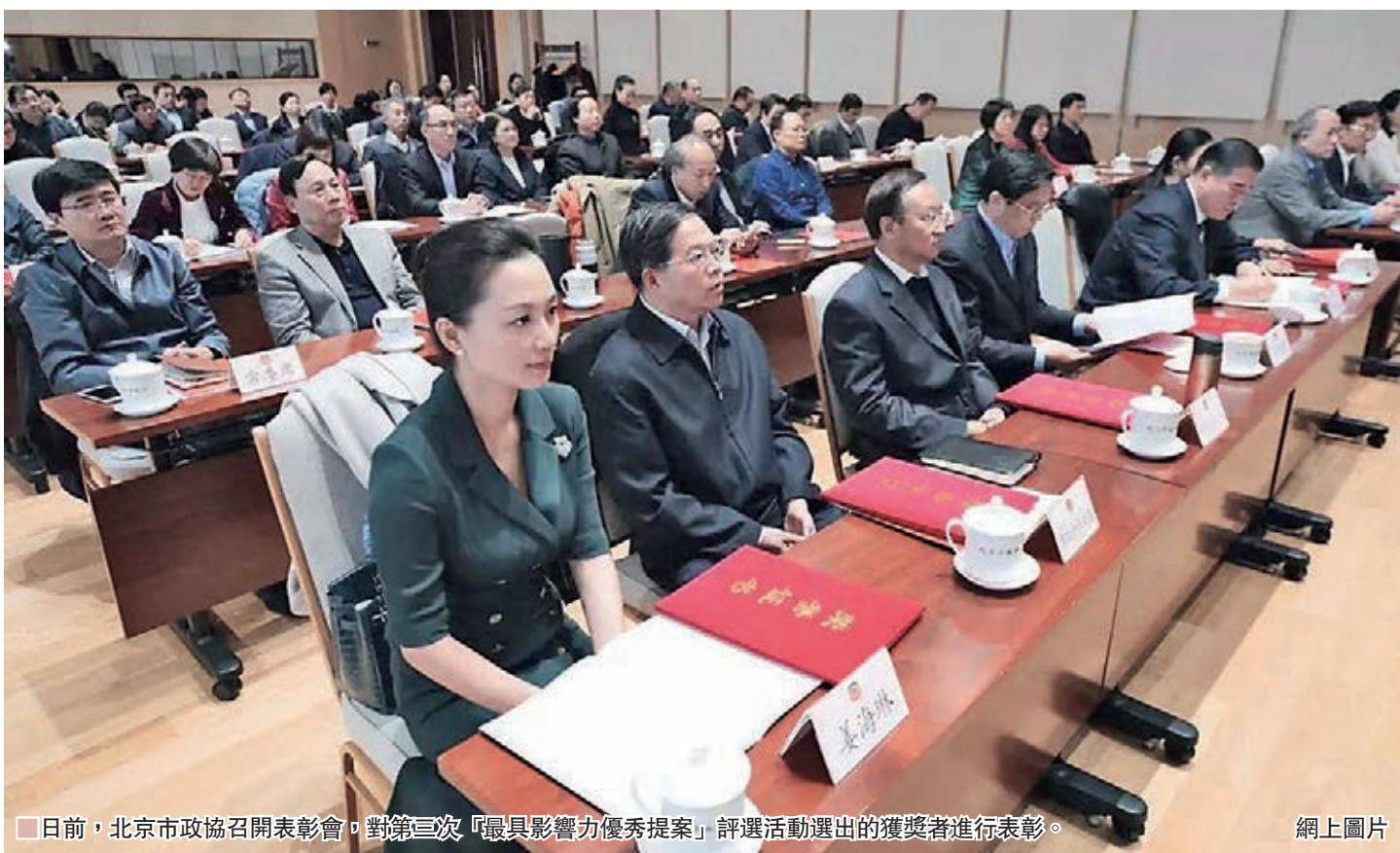
日前，北京市政協召開表彰會，對第三次「最具影響力優秀提案」評選活動選出的獲獎者進行表彰。

此次評選首設「最具影響力優秀提案」特別獎，市政協文史和學習委員會提出的《關於推進整治保護力度，加快中軸申遺進展的提案》獲得該獎項。2015年至2018年，市政協文史和學習委員會在推進中軸申遺方面持續開展了大量調研建議工作，既為中軸申遺提供了具有重要指導價值的發展方略，也將中軸申遺保護工作提升到了全新的高度。依據提案方向和內容，市文物局密集啟動了新一輪中軸申遺保護工作，提案所建議事項均已落實，包括：2017年底北京市成立了推進全國文化中心建設領導小組中軸申遺專項工作組，統籌中軸線區域各相關單位力量，每年發佈重點任務清單；景山壽皇殿建築群完成修繕並向公眾開放，市少年宮體育場遷出景山公園，住戶實現騰